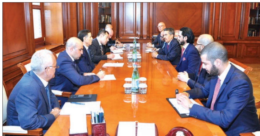
Azərbaycan Respublikasının Baş Naziri Novruz Məmmədov avqustun 30-da Səudiyyə Ərəbistanının "ACWA POWER" şirkətinin nümayəndələri ilə görüşüb.

AZƏRTAC xəbər verir ki, səmimi qəbulu görə Baş Nazirə minnətdarlığını bildiren "ACWA POWER" şirkətinin idarə heyətinin sədri Məmməd Abunayyan bildirib ki, bu il mart ayının 17-də Azərbaycan Respublikası Energetika Nazirliyi ilə Səudiyyə Ərəbistanının "ACWA POWER" şirkəti arasında əməkdaşlıq haqqında Anlaşma Memorandumu imzalanıb. Memorandum Azərbaycanca bərpə olunan enerji mənbələrindən istifadə sahəsində əməkdaşlığın əsas prinsiplərini müəyyənləşdirir. Məmməd Abunayyan bərpə edilən enerji mənbələrindən istifadə sahəsində ixtisaslaşmış şirkət olaraq enerji və su layihələri