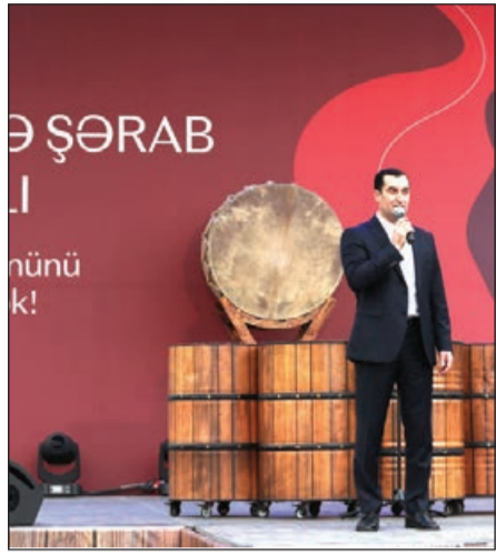
Avqustun 30-da Şamaxı rayonunun Meyseri kəndində I Azərbaycan Üzüm və Şərab Festivalının açılış mərasimi olub.