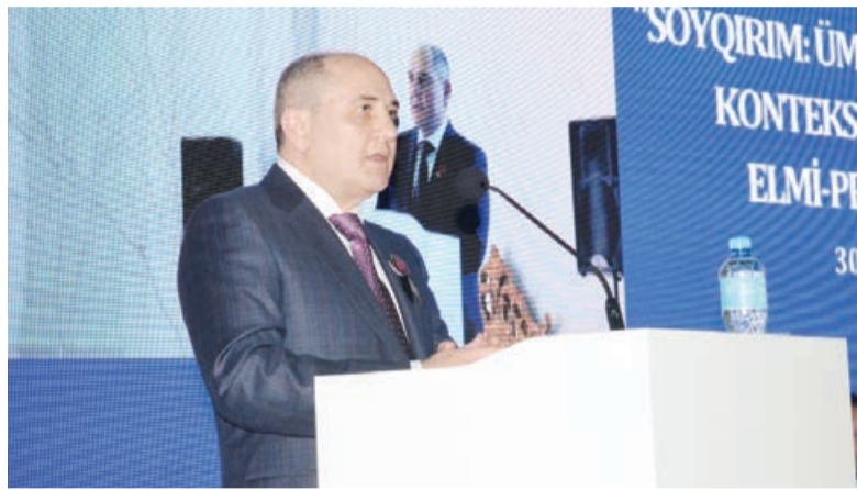
Martın 30-da Qubada Yeni Azərbaycan Partiyasının (YAP) təşkilatçılığı ilə "Soyqırım: Ümumbəşəri cinayətlər kontekstindən yeni baxış" mövzusunda elmi-praktiki konfrans keçirilib.

AZƏRTAC xəbər verir ki, 31 Mart - Azərbaycanlıların Soyqırımı Gününe həsr olunmuş konfrans iştirakçıları əvvəlcə Ümummilli Lider Heydər Əliyevin Quba şəhərinin mərkəzində ucaldılmış abidəsi önünə gül dəstələri düzüb, daha rəhbərini xatirəsinə ehtiramla anıblar.