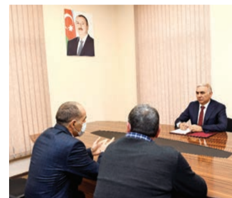
Qəbuldan əvvəl Ümummilli Lider Heydər Əliyevin İsmayılı şəhərindəki

Qəbul mərkəzi icra hakimiyyəti orqanları və digər idarəetmə qurumlarının rəhbərlərinin şəhər və rayonlarda vətəndaşların qəbulu cədvəlinə əsasən baş tutub.