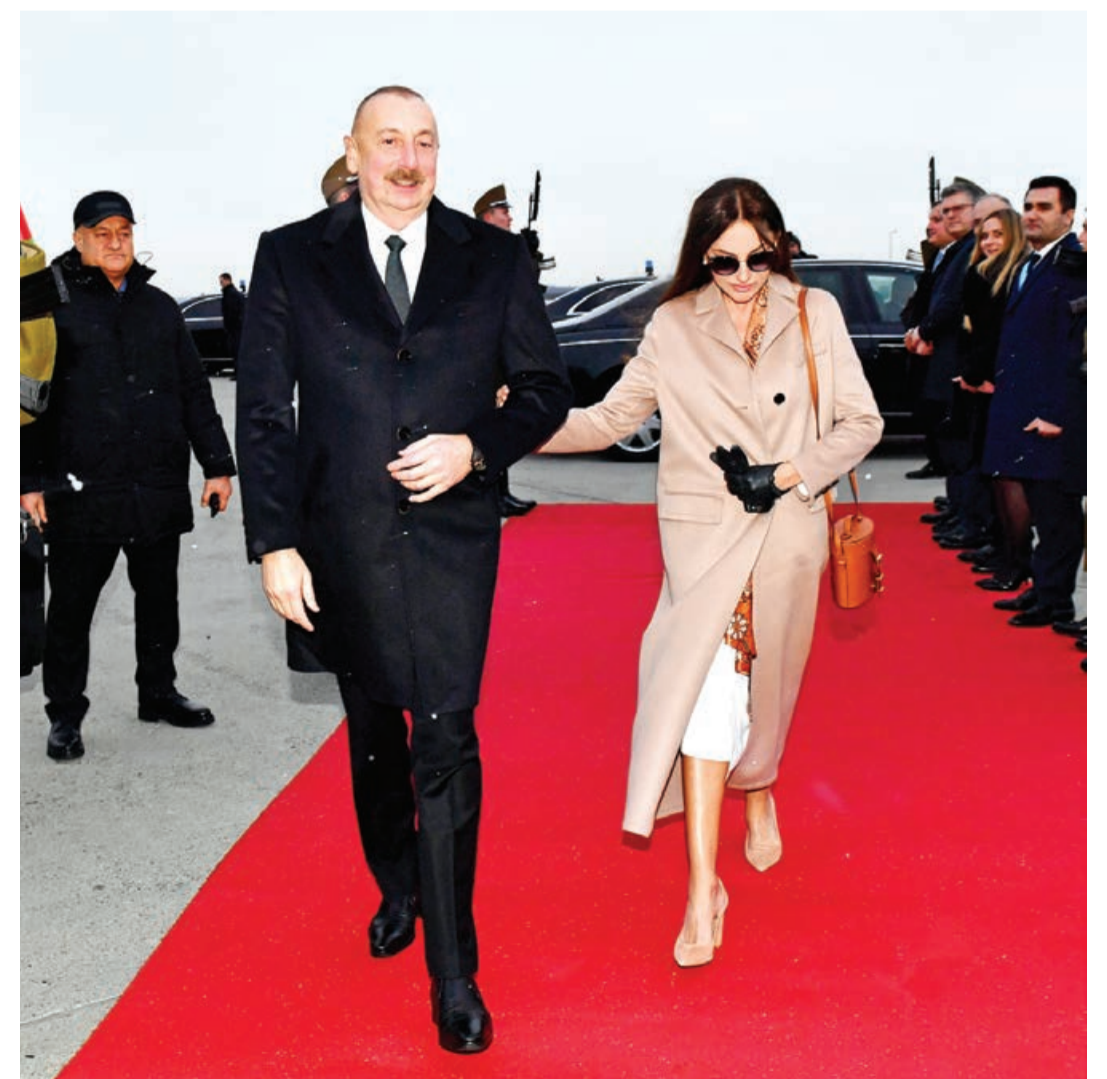
Azərbaycan Respublikasının Prezidenti İlham Əliyevin Macarıstana rəsmi səfəri yanvarın 30-da başa çatıb.

AZƏRTAC xəbər verir ki, Budapeştin Ferents List adına Beynəlxalq Hava Limanında dövlətimizin başçısının şərfinə fəxri qarovul dəstəsi düzülürdü.