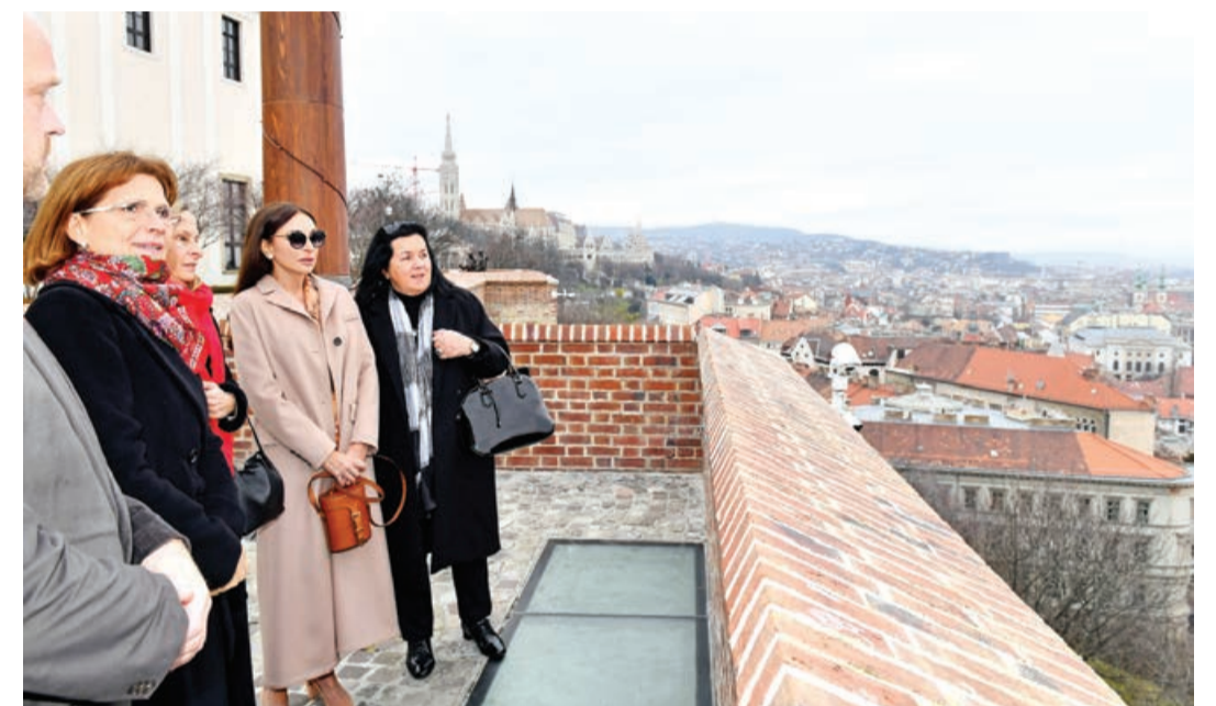
Yanvarın 30-da Budapeştdə Azərbaycan Respublikasının birinci xanımı Mehriban Əliyevanın Macarıstanın Baş naziri Viktor Orbanın xanımı Aniko Levai ilə görüşü olub.