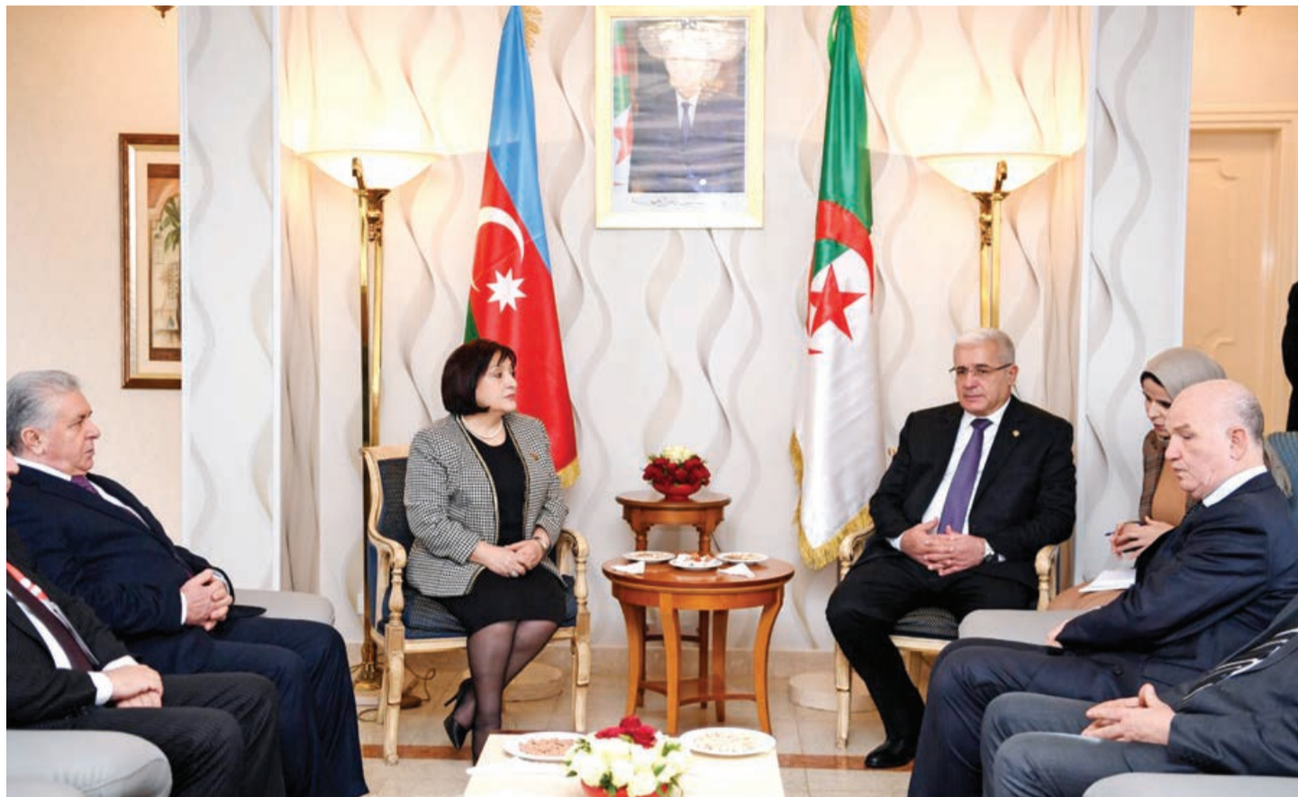
Milli Məclisin Sədri Sahibə Qafarova Əlcəzair Xalq Demokratik Respublikasına işgüzar səfəri çərçivəsində bu ölkənin Milli Xalq Assambleyasının sədri İbrahim Bouğali ilə görüşüb.

Milli Məclisin Mətbuat və ictimaiyyətə əlaqələr şöbəsinə verilən məlumata görə, Azərbaycan parlament rəhbərini səmimiyyətlə salamlayan Milli Xalq Assambleyasının sədri, ölkələrimiz və parlamentlərimiz arasında mövcud əlaqələrin məmnunluq doğurduğunu bildirdi. O, Azərbaycan Prezidenti İlham Əliyevin ötən ilin noyabrında Ərəb Dövlətləri Liqasının 31-ci Zirvə toplantısında iştirak etmək məqsədilə bu ölkəyə səfər etdiyini xatırladaraq, bu səfərin ölkələrimiz arasında münasibətlərin daha da gücləndirilməsinə mühüm töhfə verdiyini vurğulayıb.