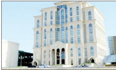
Azərbaycan Respublikasının Milli Məclisinə seçkilərlə əlaqədar MSK-ya daxil

Mərkəzi Seçki Komissiyası Katibliyinin Media və ictimai əlaqələr şöbəsinin AZƏRTAC-a bildirdiyi ki, əvvəlcə Komissiyanın 2020-ci il 21 yanvar tarixli iclasının protokolu təsdiq olunub. Sonra 2020-ci il fevralın 9-na təyin edilmiş