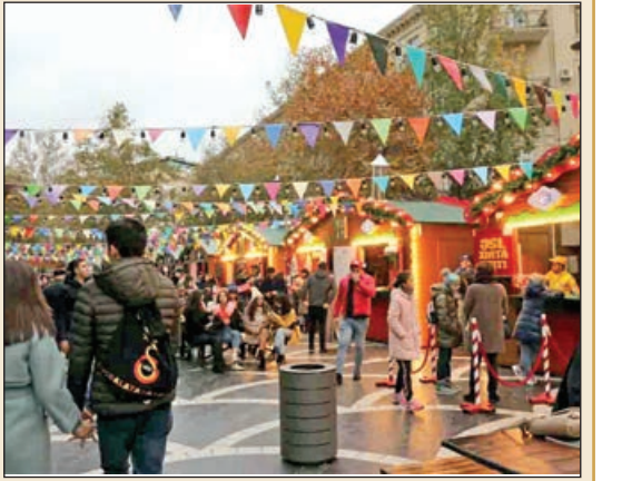
Bakı MDB məkanında Yeni il yarmarkalarına səyahət üçün ilk beş ən yaxşı şəhər sırasına daxil olub.

"TurStat" turizm portalı Yeni il qabağı istirahət günlərində və 2020-ci ilin yanvarında Yeni il şənliklərində səyahət üçün MDB məkanında, o cümlədən Rusiyada ən yaxşı Yeni il və Milad festivallarının və yarmarkalarının reytingini təqdim edib. 2019-cu ilin dekabrında və 2020-ci ilin yanvarında MDB ölkələrində turistlər üçün ən cəlbedici Yeni il və Milad yarmarkaları Rusiya, Belarus və Azərbaycanda təşkil edilir. MDB məkanında Milad yarmarkalarının reytingi Yeni il və Milad festivalları və yarmarkalarının populyarlığını və unikallığını təhlilinin nəticələrinə əsasən tərtib edilib.