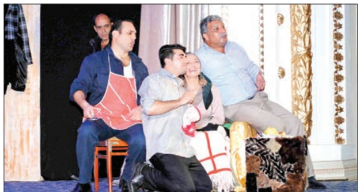
Sumqayıt Dövlət Dram Teatrı hər zaman kreativ layihələrlə fərqlənir. Son illər tamaşaçıların sayı artan teatr kollektivi demək olar ki, yeni sənə əsərlərinə müraciət edir.

Teatrda səhnələşdirilən tamaşalardan biri də "Ocaq"dır. Tamaşanın nümayişində duyğusal məqamlar yaşanır. Teatr kollektivi tamaşa bitdikdən sonra səbirsizliklə oğlunun hərbi xidmətinə ləyaqətlə başa vurub doğma Sumqayıta gəlişini gözləyən əsgər anasına sürpriz edib. Vətənə xidmətdən qayıtdıqca mehaz teatrda, anasının mədəni istiqahını keçirdiyi məkanda ona bu həyəcanlı, sevincli anları yaşatmaq istəyən Azərbaycan əsgərinin bu addımı hər kəs tərəfindən alqışlanıb. Turqut Özakmanın "Ocaq" tamaşası psixoloji dram olsa da, tamaşa sonunda baş tutan əsgərin