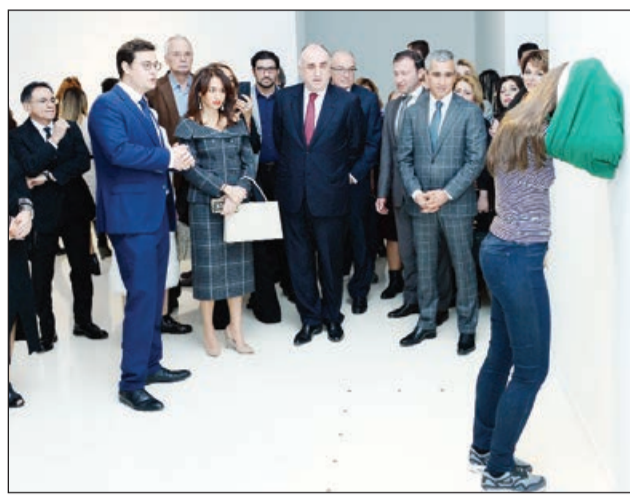
açmışıq. Yeni, bu əsərlər dünyanın müxtəlif muzeylərində və aparıcı sərği salonlarında nümayiş etdirilib. Bakı öz müasirliyi və multikultural yanaşması ilə seçilən şəhərdir. Belə bir şəhərdə bu cür sərğinin açılması təqdirəlayiqdir. Əslində, bu, incəsənətin cazibəsinin təsvir edilməsidir", - deyər Maksimilian Letste vurğulayıb.

"Yeni üsul, yeni mövzu və yeni materiallar bugünkü sərğinin əsasını təşkil edir. Bu sərğidə abstrakt incəsənətin bir növünü əks etdirir. Sərğinin ümumi ekspozisiyasına nəzər saldıqda realizmə əsaslanan müasir heykəltəraşlıq görürük. Biz bu sərğini dünyanın bir sıra ölkələrində