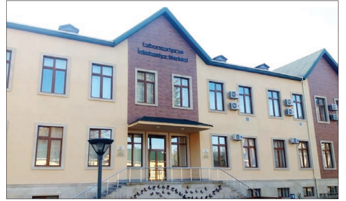
Əvvəlki 1-ci sah.

Azərbaycan özünü ipəkqurdu toxumu ilə tam təmin edə biləcək