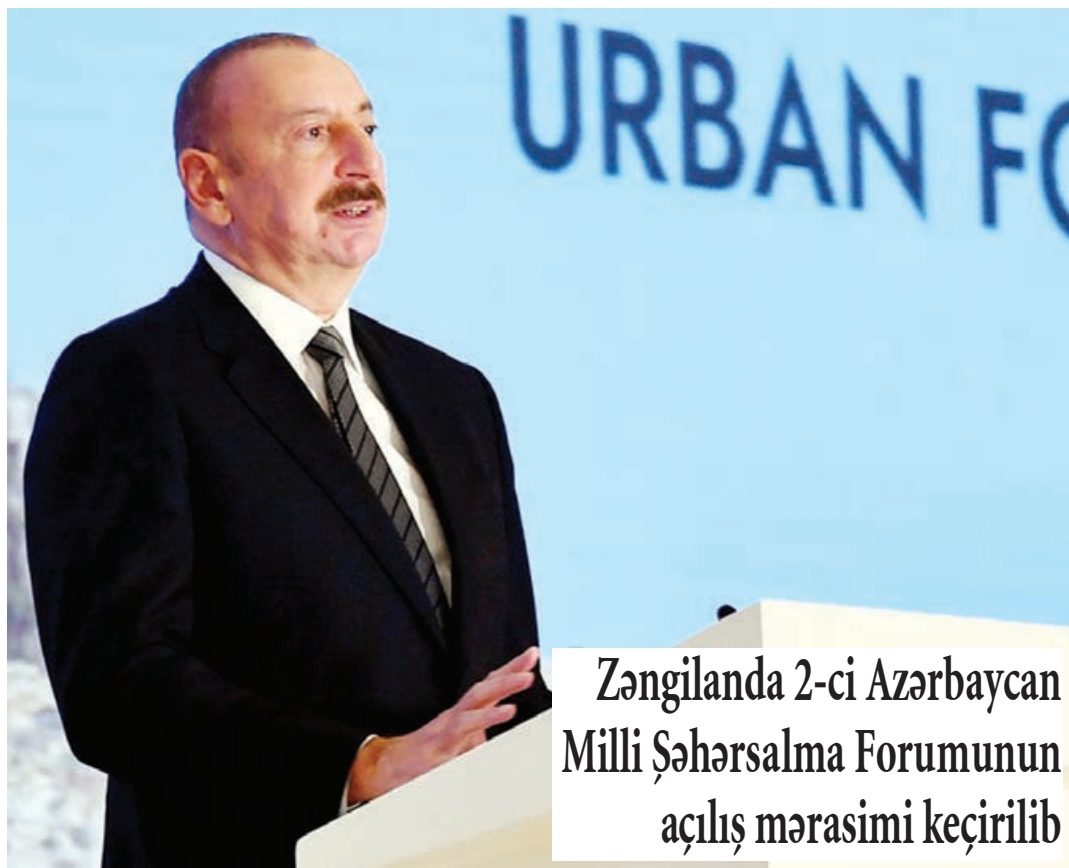
Zəngilanda 2-ci Azərbaycan Milli Şəhərsalma Forumunun açılış mərasimi keçirilib

"Böyük qayıdış" proqramının icrası bizim üçün bir nömrəli vəzifədir"