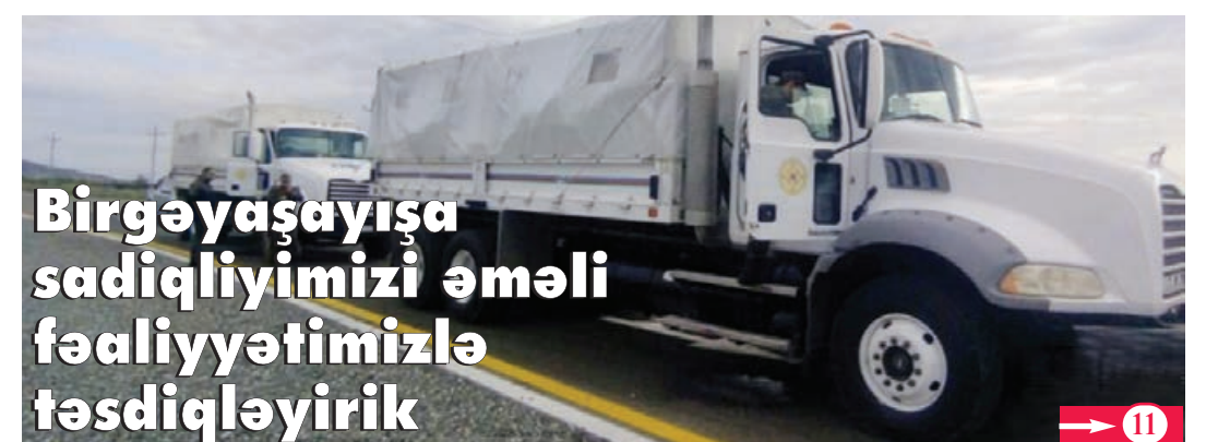
Birgə yaşayışa sadiqliyimizi əməli fəaliyyətimizlə təsdiqləyirik

sinin tikintisi planlaşdırılır və binalar körpü vasitəsilə əlaqələndiriləcək. Digər 3-4 mərtəbəli binaların tikintisi isə ikinci mərhələ üçün nəzərdə tutulur. Binaların fasadında müasirlik və milliliyin ahəngi əsas götürülüb. Belə ki, eyvanlarda milli elementimiz olan şəbəkədən istifadə ediləcək.