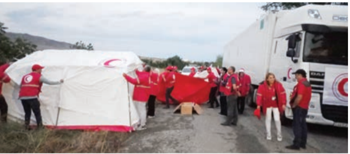
Azərbaycan Qızıl Aypara Cəmiyyətinin (AzQAC) əməkdaşları Ağdam-Xankəndi yolunda gecələyəcəklər.

AZƏRTAC xəbər verir ki, artıq Rusiya sülhməramlılarının Ağdam-Xankəndi yolunun üzərindəki postu ilə üzbuüz istiqamətdə çadırlar quraşdırılıb. Həmin çadırlarda AzQAC