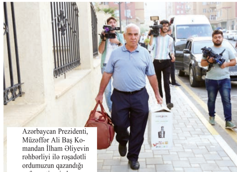
Azərbaycan Prezidenti, Müzəffər Ali Baş Komandan İlham Əliyevin rəhbərliyi ilə rəşadətli ordumuzun qazandığı zəfər nəticəsində məcburi köçkünlərin 30 ildən sonra könüllü, təhlükəsiz və ləyaqətlə doğma yurdlarına qayıtmasına imkan yarandıb.

Laçın şəhəri dünən 13 ailəyə qənaq açılıb və daha 52 nəfər laçınlının yurd həsrəti sona çatıb. Otuz bir ildən sonra yenidən Laçına qədəm qoyan ailələr sevinc göz yaşları ilə öz doğma yurduna qovuşub. Onlar şəhərdə böyük coşu ilə qarşılanıblar, illərdir həsrətini çəkdiqləri Laçın gözəl mənzərəsini seyr ediblər. Daha da gözəlləşən və abadlaşan Laçına qovuşan sakinlər hərtərəfli dövlət qayğısı ilə əhatə olunduqlarına görə Prezident, Müzəffər Ali Baş Komandan İlham Əliyevə, Birinci vitse-prezident Mehriban xanım Əliyevaya, torpaqlarımızı işğaldan qurtaran rəşadətli Azərbaycan Ordusuna, qəhrəman əsgər və zabitlərimizə minnətdarlıqlarını bildirib, bu yolda canlarından keçən şəhidləri-