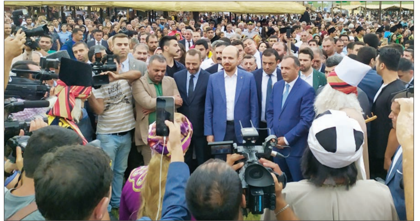
Əvvəli 1-ci sah.

O, festivalın təşkilatçıları arasında olmasından məmnun qaldığını qeyd edərək demişdir ki, tədbirə qatılan xarici ölkə nümayəndələri üç gün ərzində Azərbaycanın, o cümlədən Gədəbəyin adət-ənənələri ilə tanış olmuş, bu füsunkar diyar haqqında bilgilərini zənginləşdirmişlər.