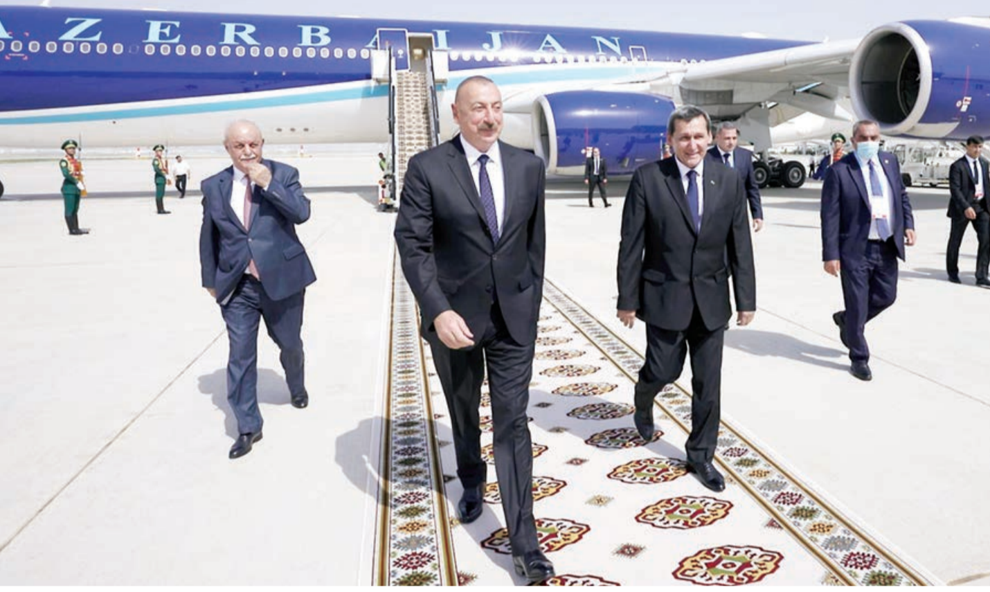
Azərbaycan Respublikasının Prezidenti İlham Əliyev Xəzər Dövlətlərinin Dövlət Başçıları VI Zirvə Toplantısında iştirak etmək üçün iyunun 29-da Türkmənistanla səfərə gəlir.

AZƏRTAC xəbər verir ki, Aşqabad Beynəlxalq Aeroportunda dövlətimizin başçısının səfərinə fəxri qarovul dəstəsi düzülüb. Prezident İlham Əliyevi Türkmənistan Nazirlər Kabineti sədrinin müavini və xarici işlər naziri Rəşid Meredov və digər rəsmi şəxslər qarşıladılar.