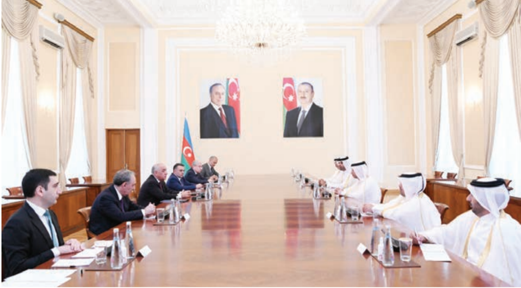
Azərbaycan Respublikasının Baş naziri Əli Əsədov iyunun 29-da Qətər Dövlətinin baş prokuroru İssa bin Səad əl-Nuaimi ilə görüşüb.

Nazirlər Kabinetinin Mətbuat xidmətindən AZƏRTAC-a bildirirlər ki, görüşdə Azərbaycan-Qətər münasibətlərinin müxtəlif istiqamətlərdə inkişaf etdiyi məmnunluqla vurğulanıb.