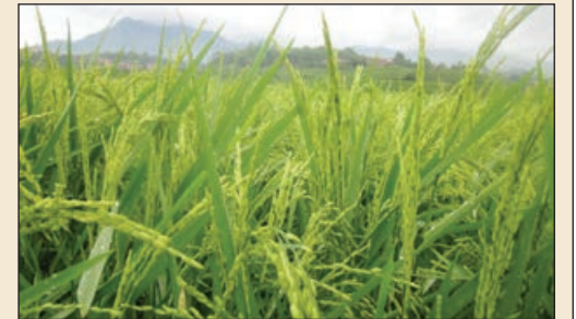
çox Xanbulaq, Qaraqoyunlu, Növcü, Kəndoba və bir sıra digər ərazi dairələrində ekilib.

Rayonda cari mövsümdə 166 hektarda kartof, 591 hektarda tərəvüz, 971 hektarda qarğıdalı, 65 hektarda günəbaxan və sair bitkilərin ekini aparılıb. Yazlıq bitkilər daha