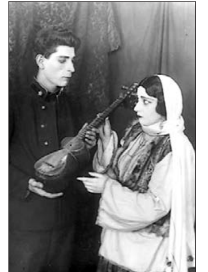
Yarımqıq qalan işlər...

Nüfuzlu teatr və mədəniyyət xadimi kimi tanınan Cəfər Cabbarlı kino sənətinə də nəbələd deyildi. 1925-1927-ci illərdə aktor və kinorejissor kurslarında oxumuşdu. Ən əsası isə kinonun problemləri barədə yalnız ədəb, mədəniyyət xadimi kimi deyil, həm də vətəndaş kimi düşündürdü. Bu sahənin əhəmiyyətini nəzərə alan Cabbarlı qeyri-peşəkar rusların, yəhudilərin ermənilərin Azərbaycanı gətirilməsindən narahət idi. O, "Azərbaycan hara gedir?" məqaləsində yazırdı: "Azərbaycan rəhbərləri sənari işini kime desəniz inanıb tapşırırlar, teki o adam Azərbaycanlı-türk olmasın. İş burasındadır ki, Azərbaycan yerli qüvvələrdən sənariçilərin hazırlığı ilə məşğul olmur. Onların həyat etdikləri "gəlmələr" isə yerli həyatla tanış olmadıqlarından bizim türklərin həyatından ağılaşmış məzə qondarmalar quraşdırırlar. Belə fikirləri dilə gətirmək, bu barədə yazmaq böyük cəsərlə tələb edirdi. Vətəndaşlıq duyğusu, vətəna, millətə məhəbbət hissi ilə yazırdı Cəfər Cabbarlı: "Azərbaycan rəhbərlərinə sual verəndə: nə üçün sizdə fabrikin nəzəndə yerləşən mətbəədə dörd mürəttibdən (özü də onları ikisi yenidən işə götürüldü) biri də türk deyil və türk yazıla-