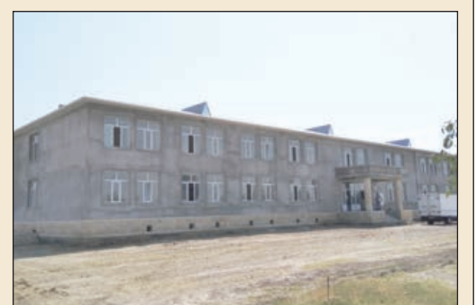
su anbarı və qazanxana tikilib, transformator quraşdırılıb.

AZƏRTAC xəbər verir ki, Təhsil Nazirliyinin sifarişli ilə tikilən məktəb binasının inşasına ötən ilin avqust ayında başlanılıb. Artıq binada hörgü işləri başa çatıb, dam örtüyü vurulub, qapı və pəncərələri quraşdırılıb, suvaq işləri görüldü. Hazırda sinif otaqları, fənn kabinetləri, akt və idman zalları və digər yardımçı otaqlarda elektrik və kommunikasiya xətləri çəkilir, divar və tavanlarda rəngləmə işləri aparılır, ərazi abadlaşdırılır. Təhsil ocağının fasiləsiz, su, istilik və elektrik enerjisi ilə təmin olunması üçün ərazidə