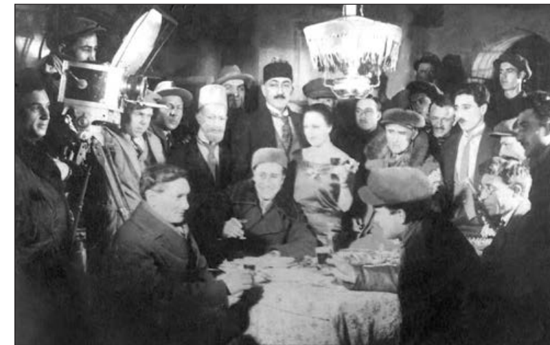
Cəfər Cabbarlı "Sevil" filmində çəkiliş qrupu ilə

Cəfər Cabbarlıın teatr sənəti ilə tanışlığı daha erkən yaşlarında başladı. O, 1915-ci ildə 3 saylı ali ibtidai məktəbdə təhsil aldığı vaxtlarda ilk səhnə əsərini - "Vəfalı Səriyyə, yaxud göz yaşları içində gülüş" pyesini qələmə aldı. Başqa bir pyesini - "Solğun çiçəklər"i də elə həmin il yazdı. Bu əsərlərdə həyatın realist boyaları təsviri, cəmiyyətdəki ədalətsizliyə, haqsızlıqlara etiraz ələ ustalıqla əksini tapdı ki, müəllifinin on altı yaşında olması hər kəsi təəccübləndirdi.