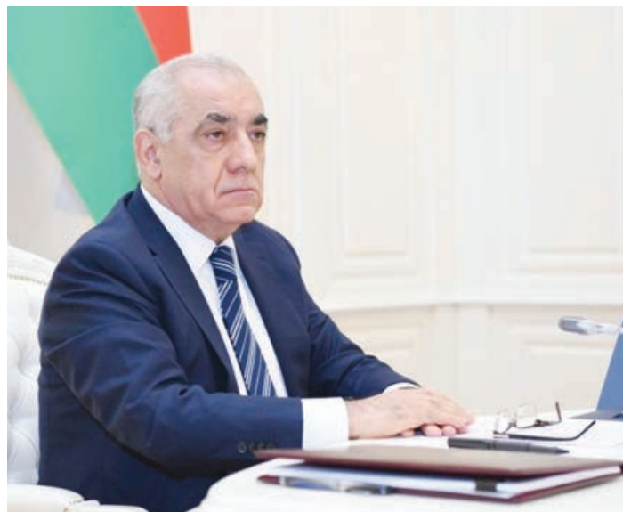
Nazirlər Kabinetinin Mətbuat xidmətindən AZƏRTAC-a verilən məlumata görə, məktubda bildirilir ki, Azərbaycan ilə Birləşmiş Ərəb Əmirliklərinin qarşılıqlı etimad və dəstəyə

Azərbaycan Respublikasının Baş naziri Əli Əsədov dekabrın 2-də Birləşmiş Ərəb Əmirliklərinin milli bayramı - Müstəqillik Günü münasibətilə Birləşmiş Ərəb Əmirliklərinin (BƏƏ) Vitse-prezidenti və Baş naziri, Dubayın Əmiri Şeyx Məhəmməd bin Rəşid Əl Maktuma təbrik məktubu ünvanlayıb.