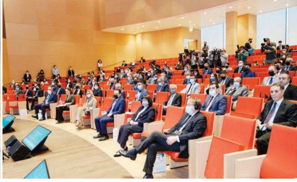
Dekabrın 2-də ADA Universitetində “Mədəniyyət naminə sülh” global kampaniyasının Tərəfdaşlar Forumu (“Peace4Culture” Partners Forum) keçirilib.

AZƏRTAC xəbər verir ki, BMT-nin Sivilizasiya Alımları, İslam Dünyası Təhsil, Elm və Mədəniyyət Təşkilatı (ICESCO), ADA Universiteti və Azərbaycan Respublikası Mədəniyyət Nazirliyinin birgə təşkilatlığı ilə reallaşan tədbirdə dövlət rəsmiləri, bir sıra beynəlxalq təşkilatların və sülhün təşviqi üzrə ixtisaslaşmış institutların, diplomatik korpusun rəhbər şəxsləri və nümayəndələri iştirak ediblər.