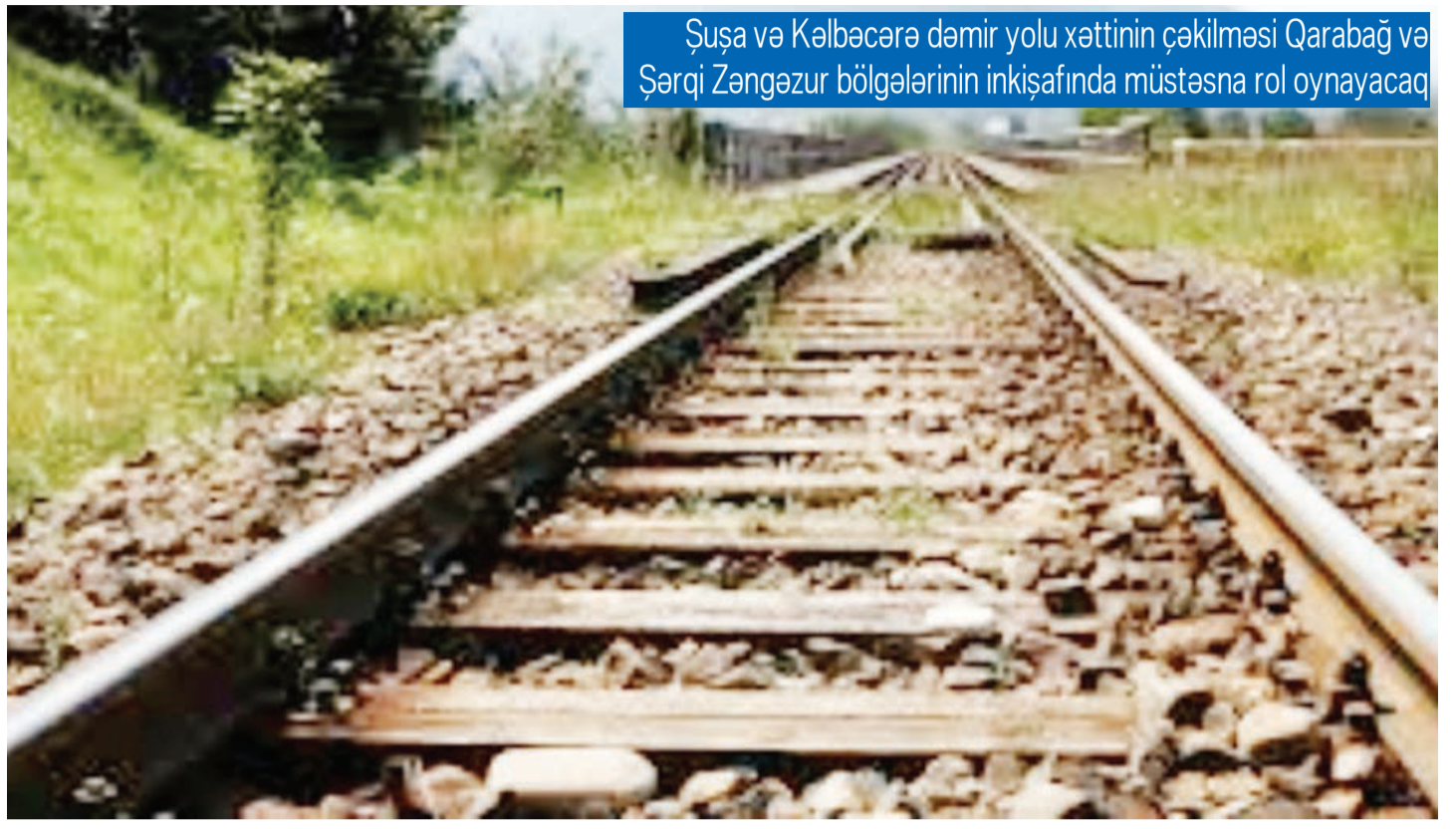
Şuşa və Kəlbəcərə dəmir yolu xəttinin çəkilməsi Qarabağ və Şərqi Zəngəzur bölgələrinin inkişafında müstəsna rol oynayacaq

Azərbaycan öz coğrafi mövqeyinə görə də dünyada əhəmiyyətli yer tutur. Ölkəmiz Şərqlə Qərbi birləşdirən ən qısa tranzit yolu üzərində yerləşir və qədim İpək yolunun Azərbaycanın keçməsi bununla bağlıdır.