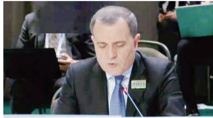
Ceyhun Bayramov ATƏT-in Nazirlər Şurasının 28-ci iclasında çıxış edib.

Mütəşəkkil cinayətkarlıq, terrorçuluq, narkotik vasitələrin qanunsuz dövriyyəsinin qarşısının alınması, sülhə və təhlükəsizliyə təhdid və maneə törədən bir sıra hallarla mübarizədə Azərbaycanın rolu vurğulanıb.