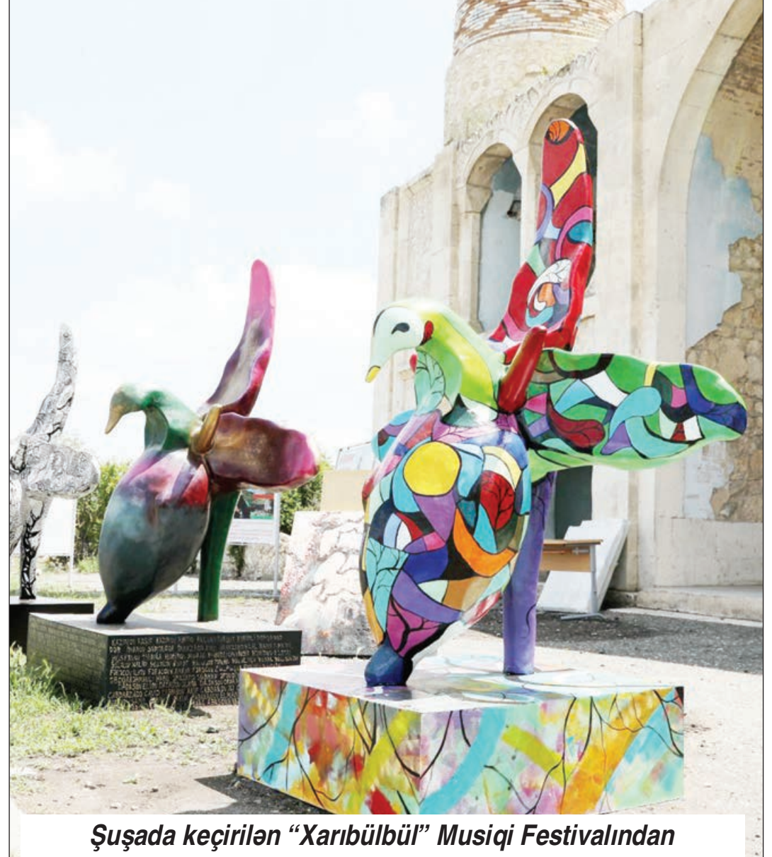
Şuşada keçirilən "Xaribülbül" Musiqi Festivalından