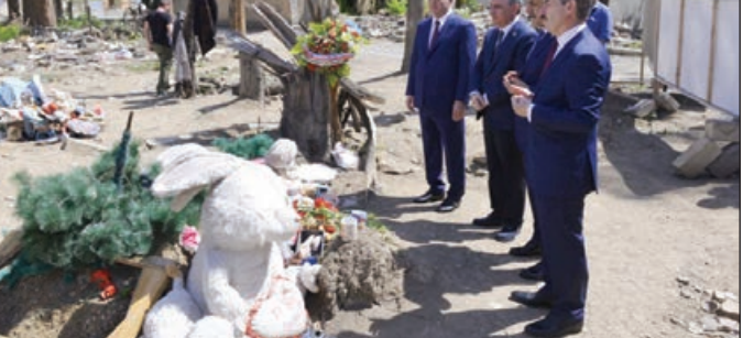
Daha sonra nümayəndə heyəti Vətən müharibəsi zamanı Ermənistan silahlı qüvvələri tərəfindən Gəncənin raket atəşinə tutulması nəticəsində dağılan ərazilərə baş çəkib. Qonaqlar günahsız mülki insanlara qarşı həyata keçirilən erməni hərbi cinayətlərinin nəticələri ilə yerində tanış olublar.

Nümayəndə heyətinin üzvləri erməni terroru zamanı həlak olan dinc sakinlərin xatirəsinə ehtiram əlaməti olaraq dağılımış evlərin ətrafına gül düzüblər.