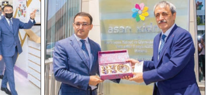
Bildirilib ki, bu gündə 44 milyondan çox vətəndaş müraciəti qeydə alınıb. "ASAN xidmət" 2015-ci ildə Birləşmiş Millətlər Təşkilatının Dövlət Xidmətləri Mükafatına, 2019-cu ildə isə BMT-nin rəqəmsal idarəetmənin tətbiqi ilə dövlət xidmətlərinin inkişafı sahəsində xüsusi mükafatına layiq görülməsi qonaqların diqqətinə çatdırılıb.