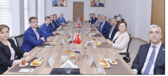
AZƏRTAC xəbər verir ki, səfər çərçivəsində dəmi Azərbaycan şairi və mütəfəkkiri Nizami Gəncəvinin məqbərəsi ziyarət edilib, burada yaradılan şəraitlə tanışlıq olub. Azərbaycan Prezidenti İlham Əliyevin Sərəncamı ilə 2021-ci ilin ölkəmizdə "Nizami Gəncəvi ili" elan olunduğu qonaqların diqqətinə çatdırılıb, dünya şöhrətli şairin irsi barədə heyət üzvlərinə ətraflı məlumat verilib.

Daha sonra nümayəndə heyəti Vətən müharibəsi zamanı Ermənistan silahlı qüvvələri tərəfindən Gəncənin raket atəşinə tutulması nəticəsində dağılan ərazilərə baş çəkib. Qonaqlar günahsız mülki insanlara qarşı həyata keçirilən erməni hərbi cinayətlərinin nəticələri ilə yerində tanış olublar.