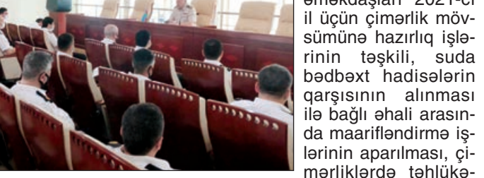
İyunun 2-də Fövqəladə Hallar Nazirliyinin (FHN) Kiçikhəcmli Gəmilərə Nəzarət və Sularda Xilasetmə Dövlət Xidmətində çimərlik mövsümü hazırlıqla əlaqədar olaraq tədris-metodik toplantı keçirilib.

FHN-in Mətbuat xidmətindən bildirilib ki, toplantıda xidmətin rəhbərliyi, dalğıcı-xəstələri qrupları və sularda xilasetmə məntəqələrinin məsul şəxsləri iştirak ediblər.