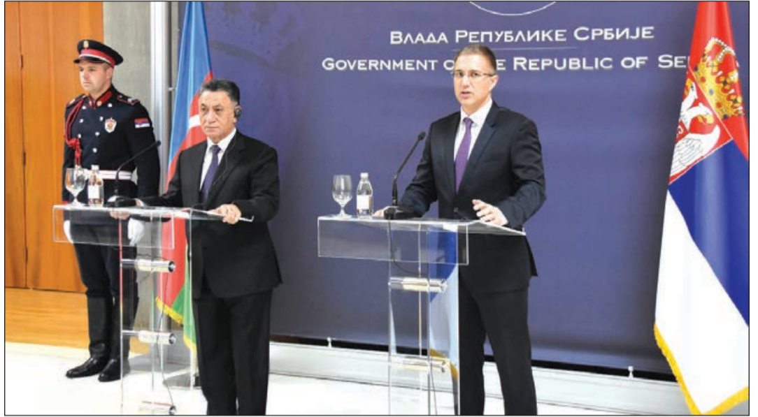
Azərbaycan Respublikasının daxili işlər naziri general-polkovnik Ramil Usubovun başçılıq etdiyi nümayəndə heyəti Serbiya Respublikası Baş nazirinin müavini-daxili işlər naziri Nebojša Stefanoviçin dəvəti ilə bu ölkədə iki günlük səfərdə olub.

Öndər Heydər Əliyevin ali hakimiyyətə qayıdırdan sonra həyata keçirilən islahatlar, ictimai-siyasi sabitliyin, əmin-amanlığın bərpası istiqamətində hüquq mühafizə, o cümlədən daxili işlər orqanlarının gücdükləri işlər barədə məlumat verib. Bu siyasətin bu gün də Azərbaycan Respublikasının Prezidenti İlham Əliyevin rəhbərliyi ilə uğurla davam etdirildiyi bildirilib.