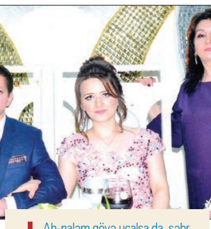
Ah-nələm göyə ucalsa da, səbr etdim. Birtəhər bu ölümlü qəbul etdim və dərddən ölmədim, yaşadım... Çünki qucağımda iki yaşlı tamam olmamış körpə vardı. Onun üçün yaşamağımı. Ona həm analıq, həm də atalıq etməliydim. Onu böyütməliydim. ...Cox şükür, oğlum böyüdü, Bakı Dövlət Universitetinin tətbiqi riyaziyyat fakültəsini bitirdi. Artıq ailə də qurub. Beləcə, həyat dayanır, öz axarı ilə gedir. Sadəcə, gədənler geri gəlir..."