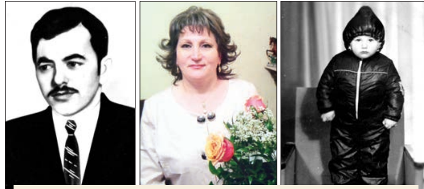
1987-ci il aprelin 29-da ailə qurduq. Bakıda yaşamağa başladım. 1988-ci ildə isə oğlumuz dünyaya gəldi. Hamı çox sevinirdi. Amma qayınamam sevinə də, gözlerindən yaş axırdı...