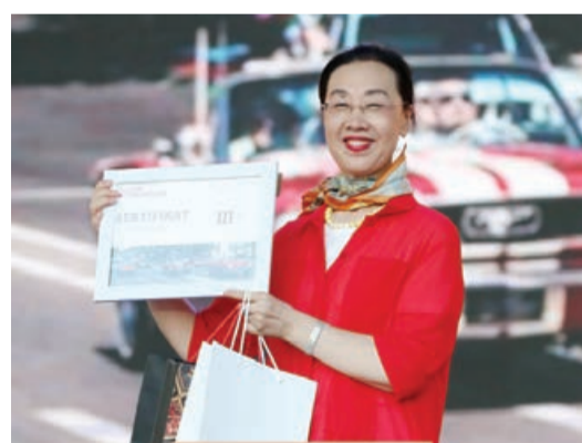
— Ən rəngarəng retro geyim və xüsusi qonaq — Çinin Azərbaycanlı səfiri Guo Min

müxtəlif incəsənət nümunələri yaradıb. Azərbaycanda ilk