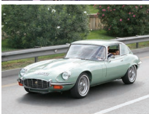
— YÜRÜŞDƏKİ — "Ən unikal avtomobil" Jaguar E-Type