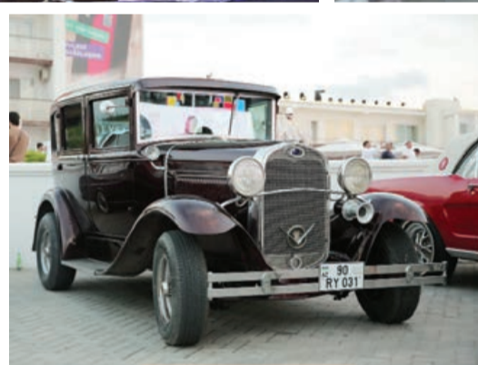
— YÜRÜŞDƏKİ — "Ən qədim avtomobil" 1931-ci il