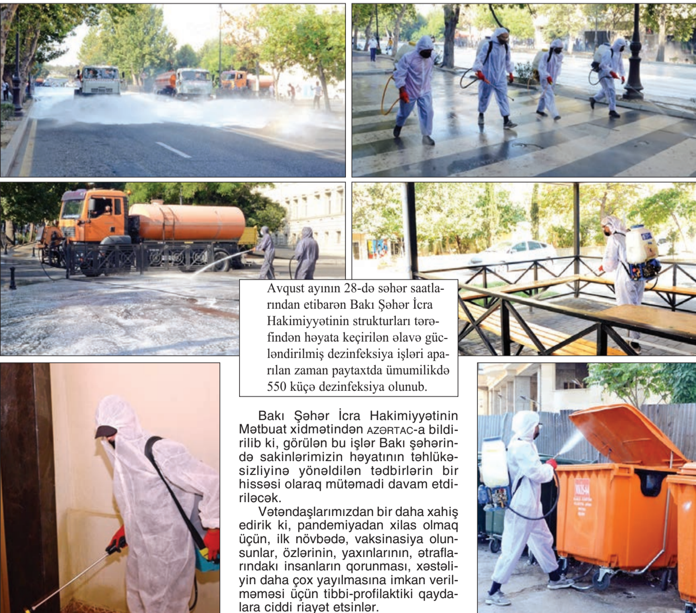
Avqust ayının 28-də səhər saatlarında etibarən Bakı Şəhər İcra Hakimiyyətinin strukturları tərəfindən həyata keçirilən əlavə gücləndirilmiş dezinfeksiya işləri aparılan zaman paytaxtda ümumilikdə 550 küçə dezinfeksiya olunub.

Bakı Şəhər İcra Hakimiyyətinin Mətbuat xidmətindən AZƏRTAC-a bildirilib ki, Bakı şəhərində sakinlərinin həyatının təhlükəsizliyinə yönəldilən tədbirlərin bir hissəsi olaraq mütəmadi davam etdiriləcək.