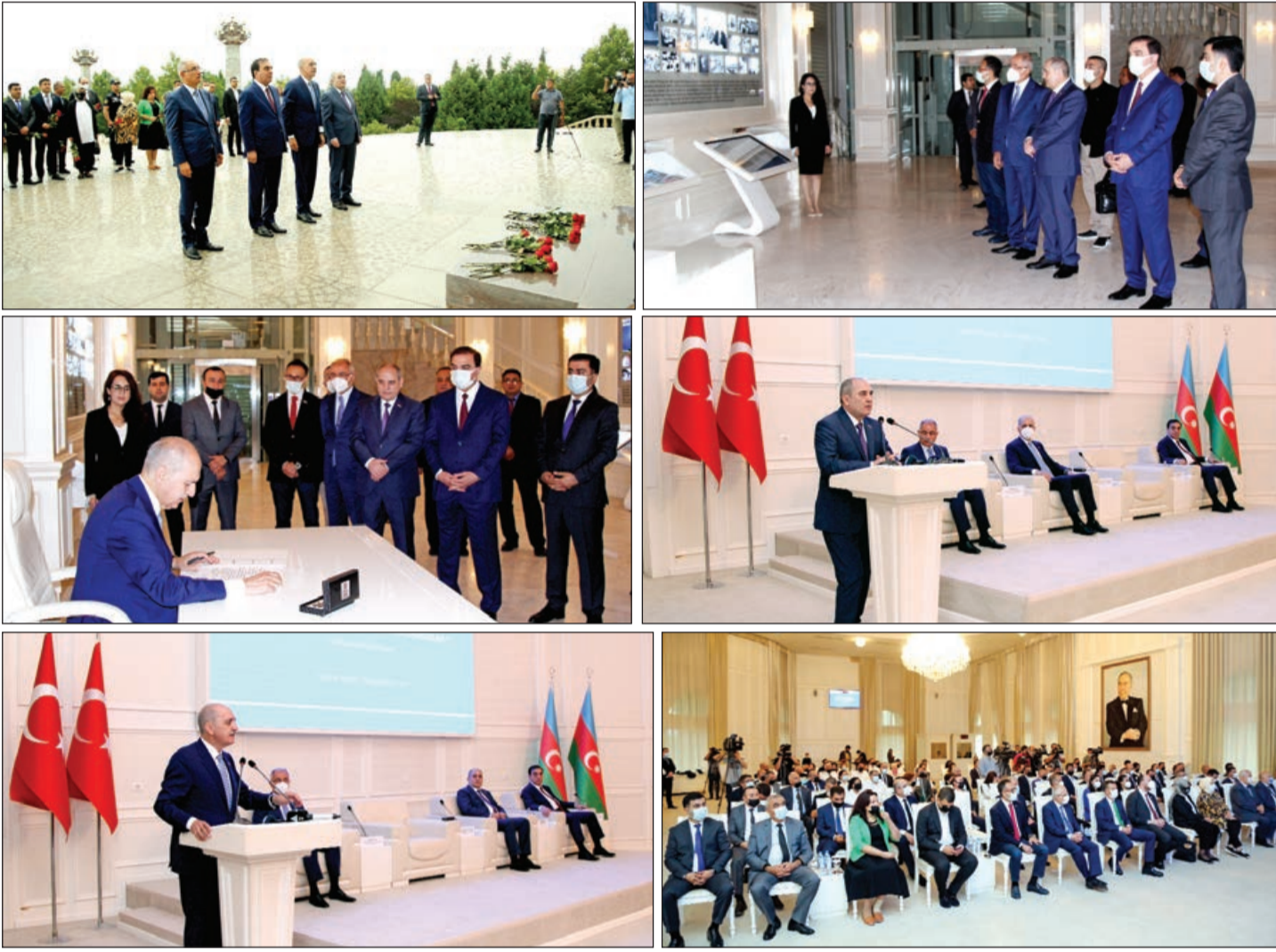
Əvvəli 1-ci səh.

İki ölkəni birləşdirən tarixi köklərin, mədəniyyətin, dinin və milli-mənəvi dəyərlərin olması ilə yanaşı, dövlət başçıları qarşılıqlı münasibətlərinin də bu əlaqələrin yüksək səviyyəyə çatmasında böyük rol oynadığını vurğulayıb. Konfransın Gəncə şəhərində keçirilməsinin təsadüfi olmadığını qeyd edən YAP sədrinin müavini-Mərkəzi Aparatın rəhbəri deyib ki, tarixən Gəncə Azərbaycanın milli istiqlal mübarizəsində, azadlıq və azərbaycançılıq ideyalarının həyata keçməsinə müstəsna xidmətləri olmuş şəhərlərimizdendir.