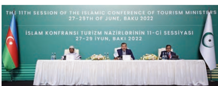
Həmçinin qətnamədə Azərbaycanın işğaldan azad olunan torpaqlarında infrastrukturun inkişafı layihələrinin icrasına üzv dövlətlərin öz sektorunun cəlb edilməsi imkanları haqqında qərar qəbul edilmişdir. "Bakı Bəyannaməsi" sənədində qarşılıqlı maraqlar əsasında üzv ölkələr arasında sağlamlıq, eko, mədəni və kənd turizminin inkişafı, birgə təşəbbüslərin dəstəklənməsi, sərgilərdə iştirak üzrə əməkdaşlıq, dayanıqlı turizmin inkişafı istiqamətində müstəqil tədbirlərin həyata keçirilməsi, islam mədəni və tarixi irsinin qorunması və təbliği, turizm islam haqqında təsəvvürlərin təkmilləşməsinə oynayaçağı rol, maliyyə institutlarının və öz sektorun üzv dövlətlərdə turizm investisiya qoyuluşuna cəlbini məsələlər öz əksini tapıb.

AZƏRTAC xəbər verir ki, "Turizmin inkişafı üzrə Qətnamə" sənədində azad olunmuş torpaqlarda təbii resursların qeyri-qanuni istismarı, ekosistem və şəhər infrastrukturunun, xüsusilə mədəni və tarixi irsin mühafizəsi, eləcə də Ermənistan ərazisində İslam mədəni və tarixi abidələrinin dağıdılması pislənib.