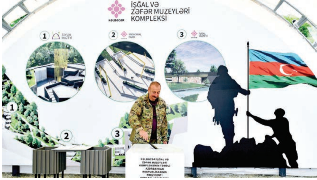
Əvvəlki 5-ci sahə.

Kəlbəcər şəhərinin Baş planı təqdim edilib, İşğal və Zəfər muzeyləri kompleksinin təməli qoyulub