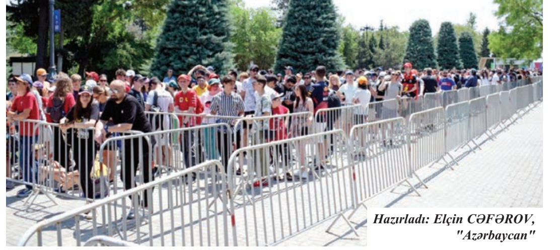
Hazırladı: Elçin CƏFƏROV, "Azərbaycan"

Bələdçilər, ölkəmizə gələn turistlər, dünyanın aparıcı pilotları, avtomobil mütoxəssisləri Azərbaycanla daha yaxından tanış olurlar, onun inkişafını gözləri ilə görürlər. Azərbaycan ardıcıl olaraq 7-ci dəfə bu yarışa yüksək səviyyədə evsahibliyi etməklə bir daha təsdiqlədi ki, beynəlxalq tədbirlərin keçirilməsi üçün əsas ünvanlardan biridir.