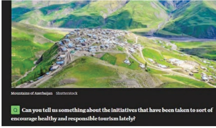
Can you tell us something about the initiatives that have been taken to sort of encourage healthy and responsible tourism lately?