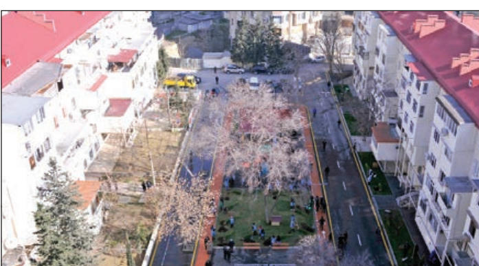
idman qurğuları, şahmat meydançası, velosiped yolu, uşaq meydançası salınıb. Eyni zamanda, ərazidə 2 söhbətqah inşa edilib, otu