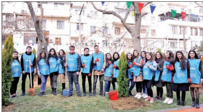
Abadlaşdırılan növbəti həyətdə ailə və sağlamliq imkanları məhdud olan insanları rahat hərəkətə nəzərə alın, bütün yaş qrupları üzrə uşaqların inkişafı üçün əlverişli şəraitin yaradılması,

Yanvarın 28-də IDEA İctimai Birliyinin təmirə ehtiyacı olan həyətlərin abadlaşdırılmasına yönəlmis "Bizim həyat" layihəsi çərçivəsində yenilənən növbəti həyat sakinlərinin istifadəsinə verilib.