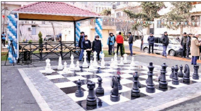
gənclərin asudə vaxtlarının səmərəli keçirilməsi və onlarda sistematik idmanla məşğulolma refleksinin yaradılması məqsədilə müxtəlif