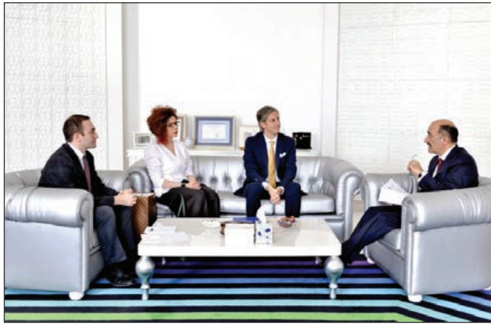
Bildirilib ki, layihənin əsas məqsədi təlimlər vasitəsilə müxtəlif formalarda olan yeni həll yollarını sınaqdan keçirmək və icra müddətini sürətləndirməkdir.