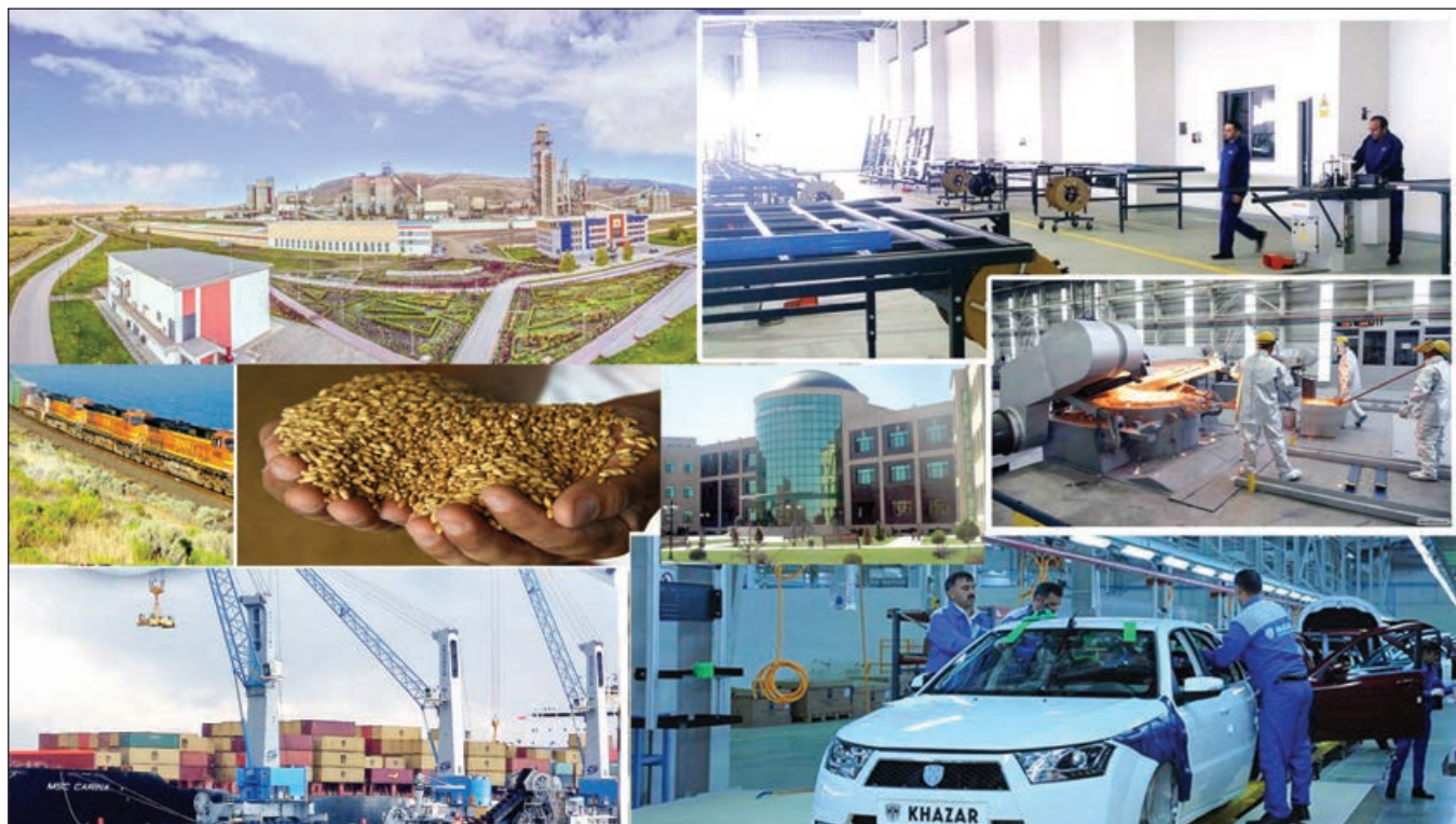
Əvvəlki 1-ci səh.

Mədənçixarma sektoru üzrə neft hasilatı 3,3 faiz azalmış, əmtəəlik qaz hasilatı 27,2 faiz artmışdır.