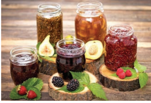
Janna Dark və Kral XIV Lüdvikin sevimli qidası

Çayın "dostu" olan, birlikdə süfrələrə təqdim edilən və ya səhər yeməyində çörək üzərinə yaxılaraq yeyilən mürəbbələr çox insanın xoşladığı qidadır. Mürəbbənin tarixi olduqca qədimlərə gedib çıxır. Belə ki, onun hazırlanmasına təxminən 2,6 milyon il əvvəl Daş dövründə qidaların müəyyən müddət saxlanılması yollarının araşdırılması zamanı başlanmışdır.