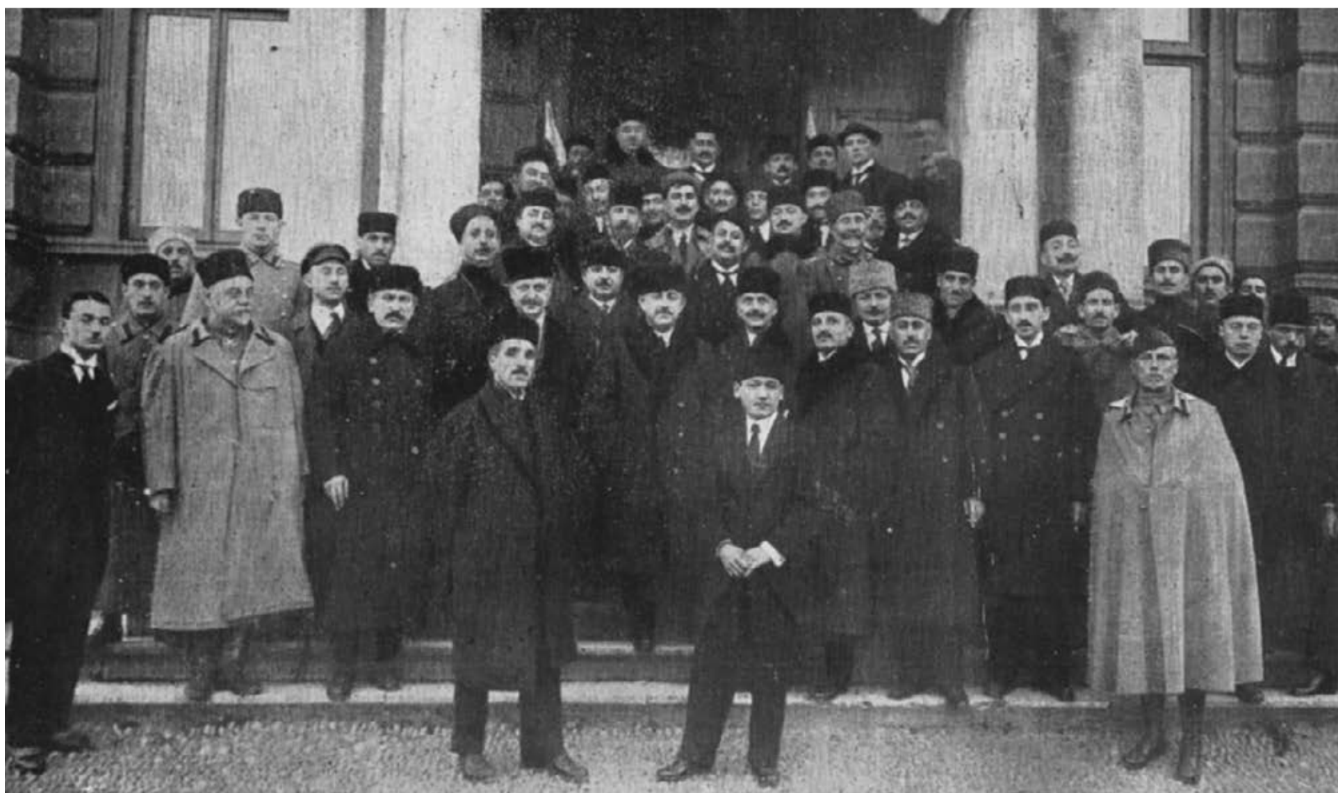
Azərbaycan Xalq Cümhuriyyəti parlamentinin və hökumətinin üzvləri AXC-nin rəsmən tanınması mərasimində

parlamentin qəbul etdiyi qanunlar, ölkədə siyasi, iqtisadi və mədəni inkişafın təmin olunması, habelə demokratik prinsiplərin təsbit edilməsi üçün görülən işlər o 23 aylıq tarixi qürur dolu səhifələridir.