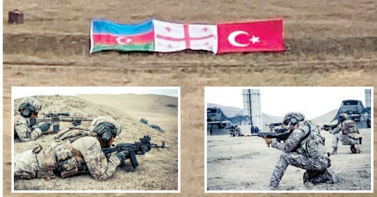
Təlimlərin keçirilməsinin qanunlaşdırılması vacib idi

Son illər Azərbaycanın ordu quruculuğunda xüsusi diqqət yetirilən məsələlərdən biri də müntəzəm olaraq müxtəlif miqyaslı hərbi təlimlərin keçirilməsidir. Diqqəti cəlb edən məqam ondan ibarətdir ki, əvvəlki dövrlərdən tam fərqli olaraq on minlərlə ehtiyatda olan hərbi mükəlləfiyyətlilər də təlimlərə cəlb edilir və onların hərbi ixtisaslarına uyğun təkmilləşdirilməsi həyata keçirilir. Eyni zamanda qardaş və dost ölkələrlə imzalanmış sazişlər, memorandumlar əsasında birgə təlimlər də reallaşır. Bu təlimlər xalqlar arasındakı dostluğun, sıx əməkdaşlığın bir nümunəsidir.