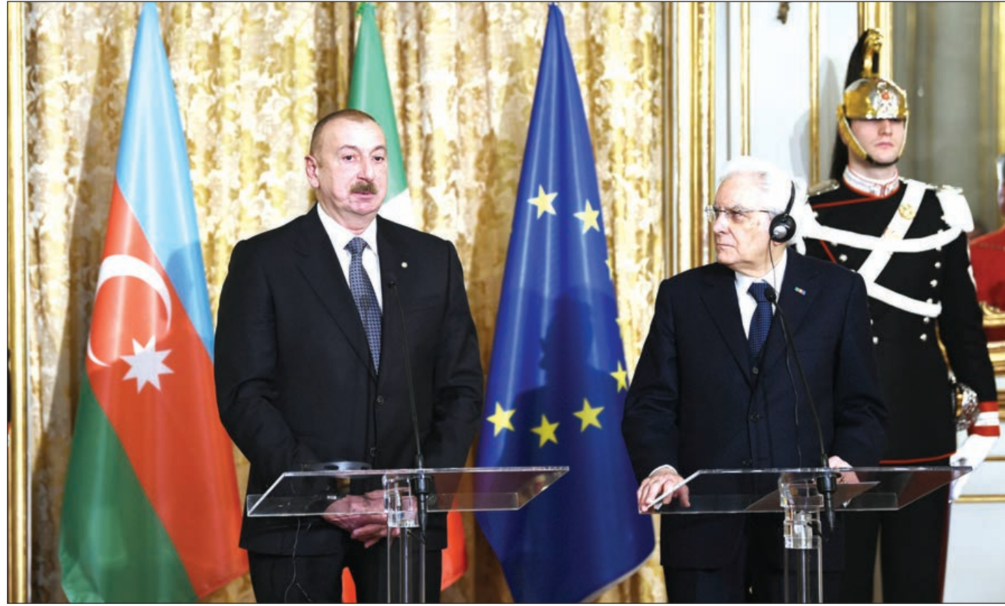
Əvvəli 1-ci səh.

Biz bu layihəni yalnız dostluq şəraitində icra edə bilərik. Demək olar ki, biz layihənin artıq son mərhələsindəyik. “Cənub qaz dəhlizi”nin üç seqmenti artıq fəaliyyət göstərir. Dəhlizin sonuncu hissəsi olan TAP-in (Trans-Adriatik Qaz Boru Kəməri) çəkilişi də sona çatmaq üzrədir. Belə ki, layihənin 92 faizi icra olunub və kəmərin bu ilin sonunadək işə düşəcəyi gözlənilir.