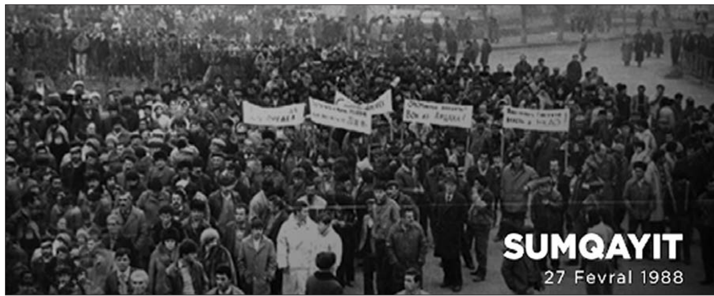
SUMQAYIT 27 Fevral 1988

1988-ci ilin fevralında Xankəndidə erməni millətçiləri kütləvi mitinqlər keçirdi. Onlar SSRİ və Ermənistan SSR rəhbərliyindən tələb edirdilər ki, Dağlıq Qarabağ Azərbaycan Respublikasının tərkibindən çıxarılıb, Ermənistan Respublikasına qatılsın. Bu, antikonstitusion bir tələb idi. Bakıda, Sumqayıtda və Azərbaycanın ayrı-ayrı bölgələrində ermənilərin haqsız tələblərinə qarşı etiraz dalğası gücləndi. Azərbaycan torpaqlarının toxunulmazlığı rəsmi şəkildə elan olundu.