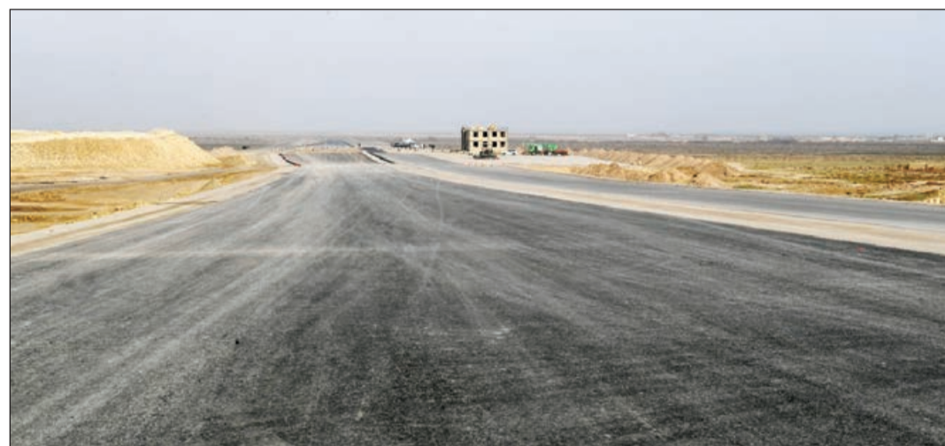
Əvvəli 1-ci sahə.

Bu hissələrdə yolun tam eni 27,5 metr olacaq. Hərəkətin hər iki istiqamətində iki zolaq olacaq. Yol ödənişli olub, inşaat və sənaye layihələrində iştirak edirlər. Bakıda bir çox müasir binanın inşaatında, dizaynında və memarlığında Türkiyə şirkətlərinin izi vardır. Burada xarici şirkətlər arasında dövlət xətti ilə gerçəkləşən layihələrdə Türkiyə şirkətləri böyük üstünlük təşkil edir. Bu da təbiiirdir. Çünki biz hər bir sahədə bir-birimizi dəstəkləyirik, həm siyasi sahədə, həm də iqtisadi və ticarət sahələrində. Qarşılıqlı ticarət dövriyyəsi də artır. Artıq hazır olan preferensial ticarət anlaşması da imzalanandan sonra ticarət dövriyyəsi daha da artacaq.