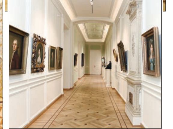
Əvvəlki 1-ci səh.

Burada ayrı-ayrı vaxtlarda müxtəlif idarə və təşkilatlar də özlərinə sığınacaq tapmışdır. 1936-cı ildə əsas qoyulan binada 1951-ci ildən Milli İncəsənət Muzeyi də fəaliyyət göstərməyə başlamışdır. Burada çoxlu sayda qiymətli maddi-mədəni sənətlərin yerləşdirilməsi və ekspozisiyasının ildən-ildə zənginləşdirilməsi bu sənət məbədinə marağı daha da artırıb. Zaman keçdikcə təbii aşınmalar nadir sənət nümunələrinin toplandığı binanın təmiri zərurətini yaradıb.