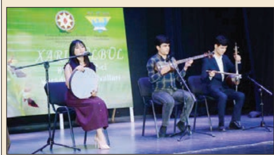
Binəqədi rayonu Şuşa Dövlət Musiqili Dram Teatrında "Xarı bülbul" gənclərin 2-ci yaradıcılıq festivalı keçirilib.

Azərbaycan Respublikasının Prezidenti yanında Qeyri-Hökumət Təşkilatlarına Dövlət Dəstəyi Şurası və Binəqədi Rayon İcra Hakimiyyətinin dəstəyi ilə Gənclər üçün Təhsil Mərkəzinin təşkilatçılığı ilə keçirilən festivalın əsas məqsədi gənclərin mədəni incilərini təbliğ etməkdir, gənclərin yaradıcılıq potensialını üzə çıxarmaqdan, uşaq və yeniyetmələrdə yaradıcılığa maraqla yanaşmağa ibarətdir.