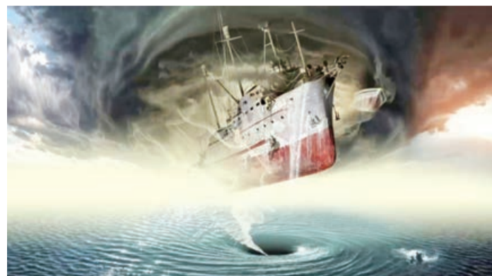
Bermud üçbucağı Atlantik okeanın şimalında Florida, Bermud adaları və Puerto Rikonu birləşdirən xətti xətlərin əhatə etdiyi üçbucaq ərazidir.

Möcüzələr və müəmmalarla dolu olan bu yer planetin ən dəhşətli və müdhiş ərazisi hesab olunur. Buraya "Atlantik qəbiristanlığı", "ölüm və ya şeytan üçbucağı" da deyilir. Səbəb isə bu ərazidən keçən gəmilərin, təyyarələrin və s. heç bir iz qoymadan yoxa çıxmasıdır.