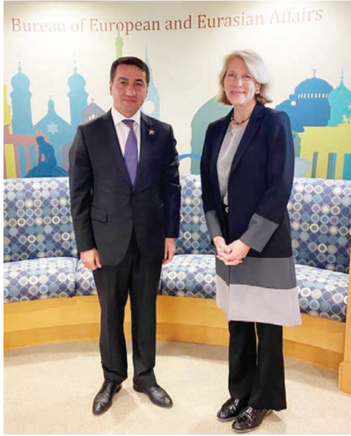
Azərbaycan Prezidentinin köməkçisi-Prezident Administrasiyasının Xarici siyasət məsələləri şöbəsinin müdiri Hikmət Hacıyev ABS Dövlət katibinin Avropa və Avrasiya məsələləri üzrə köməkçisi Karen Donfried ilə görüşüb. AZƏRTAC xəbər verir ki, bu barədə Hikmət Hacıyev tvitər hesabında bildirib.

H.Hacıyev və K.Donfried arasında keçirilmiş görüşdə münaqişələrin normalaşdırılması prosesinin hazırkı vəziyyəti, sülh müqaviləsi, sərhədlərin delimitasiyası və nəqliyyat məsələləri, o cümlədən ikitərəfli strateji əlaqələrin inkişaf perspektivləri müzakirə olunub.