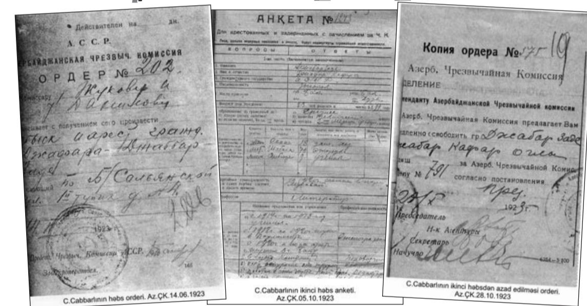
C. Cabbarlının həbs orqanı. Az.ÇK.14.06.1923 C. Cabbarlının ikinci həbs anketi. Az.ÇK.05.10.1923 C. Cabbarlının ikinci həbsdən azad edilməsi orqanı. Az.ÇK.28.10.1923