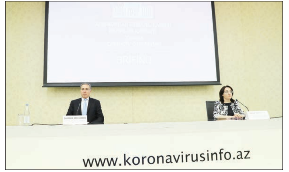
dozanı vurdurulmalıdırlar. Hazırda bu prosesin operativ təbii üçün “ASAN xidmət” tərəfindən program təminatı hazırlanıb. Bu program təminatı haqqında mərkəz tərəfindən əlavə açıqlama verilməyəcək.