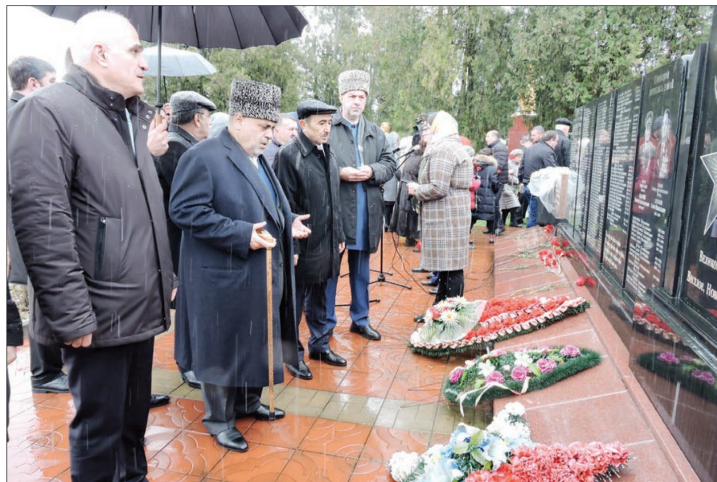
Əvvəlki 5-ci səh.

Azərbaycan nümayəndə heyəti anım mərasimində iştirak edib