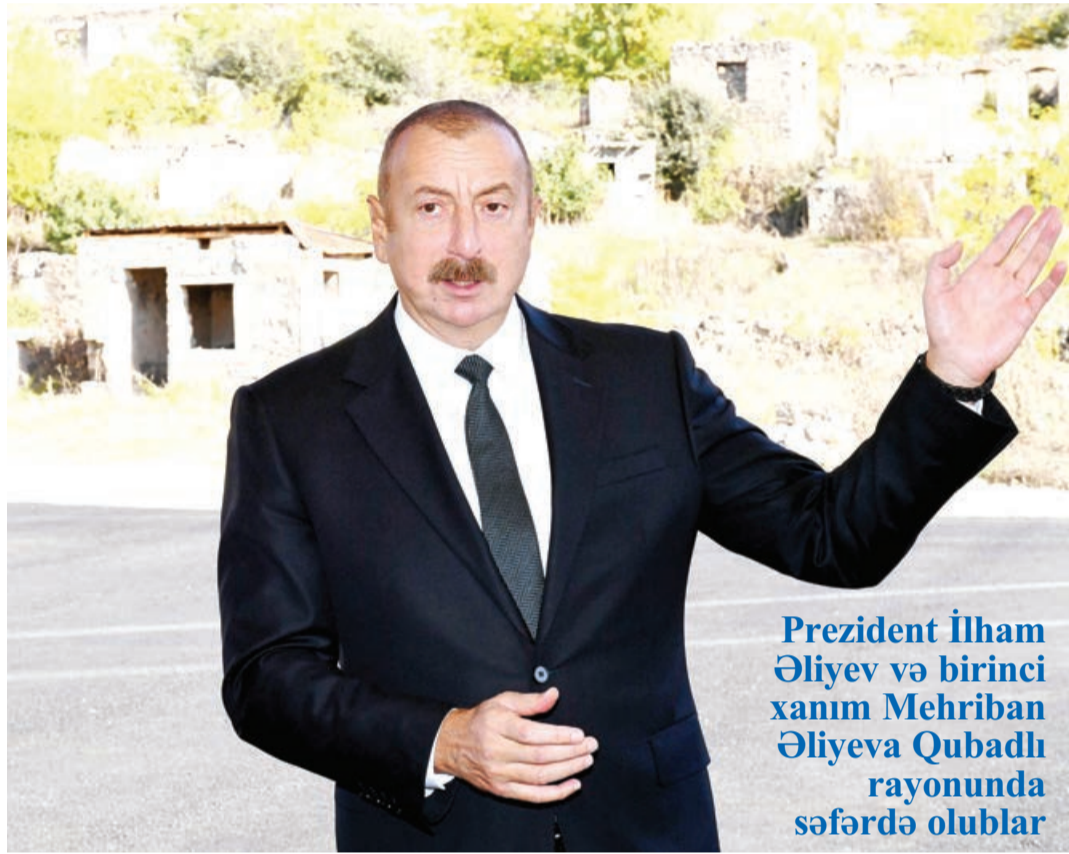
Prezident İlham Əliyev və birinci xanım Mehriban Əliyeva Qubadlı rayonunda səfərdə olublar

“Mənim üçün ən böyük mükafat keçmiş köçkünlərin gözlərindəki sevincdir”