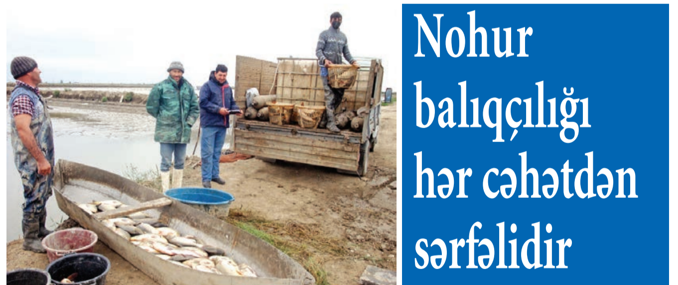
Bu saha ölkədə balığa olan tələbatı ödəməklə yanaşı, əkinə yararsız torpaqlardan istifadəyə də imkan verir

Nohur balıqçılığı hər cəhətdən sərfəlidir