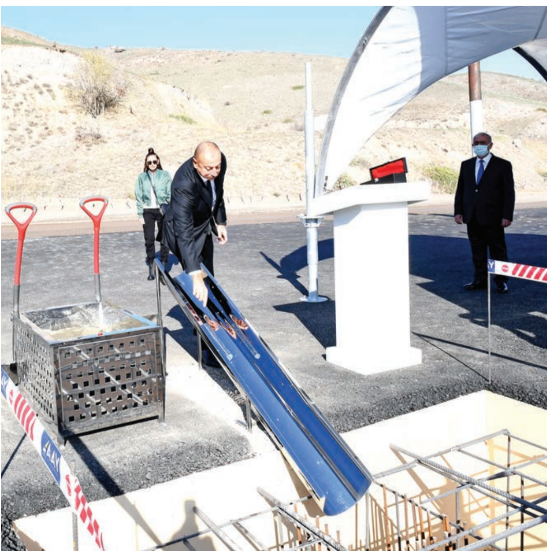
Əvvəlki 1-ci səh.

Xudafərin-Laçın avtomobil yolunun Xanlıq yaşayış məntəqəsindən ayrılaraq Qubadlı şəhərinə qədər 14 kilometr uzunluğunda yeni avtomobil yolu inşa ediləcək. Prezident İlham Əliyevin tapşırığına əsasən, Qarabağın inkişaf planı