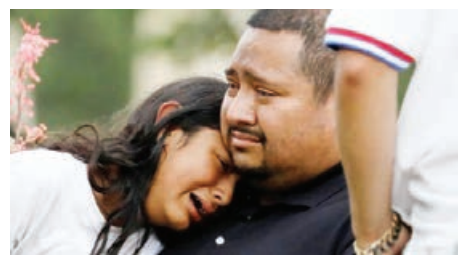
dirmaq iradəsi olan qanunvericilərə ehtiyacımız var".

Texas ştatının respublikaçı senatoru Ted Kruz hadisəni "dəhşətli olay" adlandırır, lakin onun fikrincə, silah dövrüyyəsi ilə bağlı qanunda islahatlar bu cür hücumların qarşısını almağa kömək etməyəcək: "Qanuna tabe olan vətəndaşların hüquqlarını məhdudlaşdırmaq nəticə verməyəcək. Bu, səmərəsizdir və cinayətin qarşısını almır. Əvvəlki təcrübəyə əsaslanaraq, uşaqların həyatını təhlükəsiz saxlamaq üçün ən təsirli üsul məktəbləri silahlı mühafizəçilərlə təmin etməkdir".