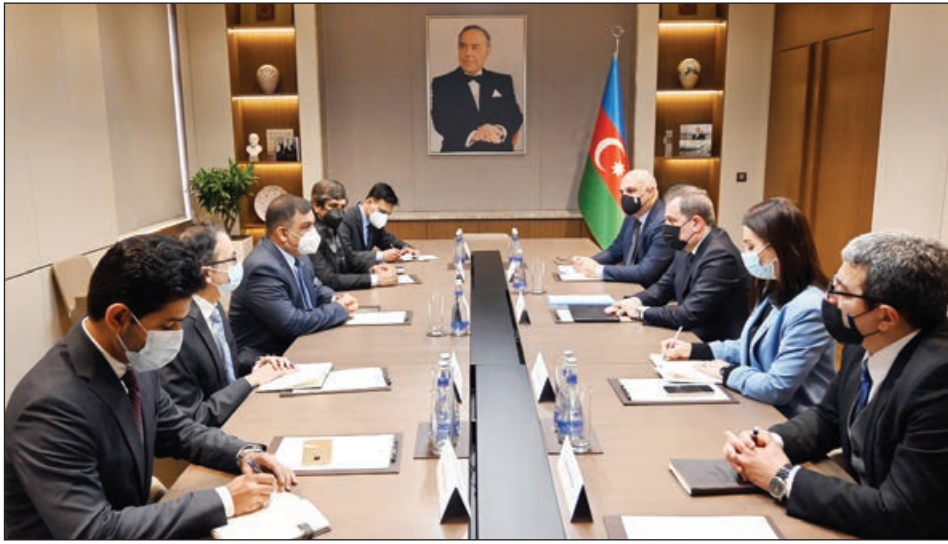
səmimi qəbulu görə nazir Ceyhun Bayramova təşəkkürünü bildirib, Azərbaycan dövləti və xalqını Qələbə münasibətilə bir daha təbrik edib. O, işğaldan azad olunan məntəqələrə səfərləri çərçivəsində bu ərazilərdə törədilmiş dağıntıların miqyasının şahidi olduğunu təəssüflə qeyd edərək, buna rəğmən, ərazilərin Azərbaycanın nəzarətinə qaytmasından böyük fəxr hiss etdiklərini vurğulayıb. Söhbət zamanı qarşı tərəf cari səfəri olduqca məhsuldar qiymətləndirib. Görüşdə həmçinin ikitərəfli əlaqələrin gələcək inkişaf perspektivləri üzrə fikir mübadiləsi aparılıb.

Fevralın 25-də Azərbaycan Respublikasının xarici işlər naziri Ceyhun Bayramov Pakistan İslam Respublikasının Sərhəd İşləri Təşkilatının Baş direktoru general-mayor Kamal Azfarın başçılıq etdiyi nümayəndə heyəti ilə görüşüb. Xarici İşlər Nazirliyinin Mətbuat xidməti idarəsindən AZƏRTAC-a bildirilib ki, nazir Ceyhun Bayramov qarşı tərəfi səmimiyyətlə salamlayıb, Azərbaycan Respublikası ilə Pakistan İslam Respublikası arasında mövcud olan dostluq və qardaşlıq münasibətlərinin cari vəziyyətini məmnunluqla qeyd edib. Pakistanın Azərbaycanın beynəlxalq hüquqa əsaslanan ədalətli mövqeyini hər zaman dəstəkləməsinin Azərbaycan dövləti və xalq tərəfindən yüksək qiymətləndirildiyi qarşı tərəfin diqqətinə çatdırılıb. Sərhəd İşləri Təşkilatının səfəri çərçivəsində keçirdiyi görüşlərin və işğaldan azad olunan ərazilərə baş çəkənlərinin bölgədəki vəziyyətlə yaxından tanış olmaq üçün əlverişli imkan yaratdığı qeyd olunub. Ümumilikdə bu səfərin faydalı olacağı və ölkələrimiz arasında inkişaf edən əlaqələrə müsbət töhfə verəcəyinə inam ifadə edilib. Sərhəd İşləri Təşkilatının Baş direktoru general-mayor Kamal Azfar, öz növbəsində,