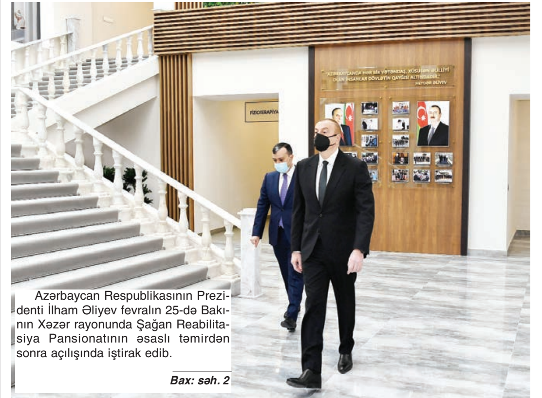
Azərbaycan Respublikasının Prezidenti İlham Əliyev fevralın 25-də Bakının Xəzər rayonunda Şağan Reabilitasiya Pansionatının əsaslı təmirdən sonra açılışında iştirak edib.