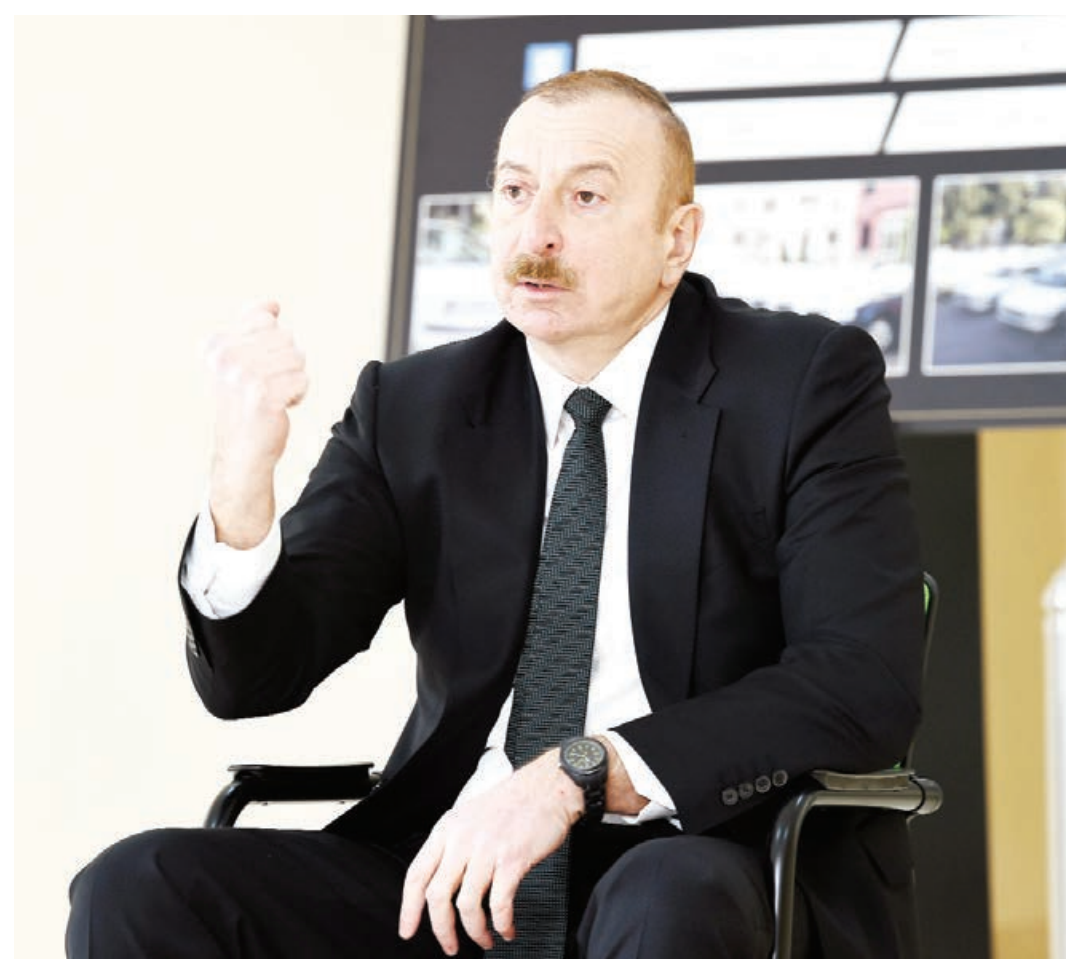
ürəkəndə təbrik edirəm. Müharibədən cəmi üç ay yarım keçib, ancaq şəhid ailələri və müharibə əilləri üçün artıq belə gözəl yaşayış kompleksi, şəhərcik inşa olunub, təqdim edilib.

- Bu gün Bakının Ramana qəsəbəsində şəhid ailələri və müharibə əilləri üçün yeni yaşayış kompleksi istifadəyə verilir. Bu münasibətlə sizi təbrik edirəm. Burada otuz bina inşa edilib. Binaların hamısı müasir səviyyədə, yüksək keyfiyyətlə tikilib, mənzillər də çox genişdir, işıqlıdır. Uşaq bağçası, 1200 şagird yerlik məktəb inşa edilib. Yeni yaşayış üçün bütün imkanlar var və bu münasibətlə sizi