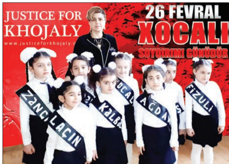
duqları acı həqiqətləri bu günlərdə bir daha xatırladılar. Məktəbdə, eləcə də ayrı-ayrı siniflərdə keçirilən tədbirlərdə

Bakıdakı Milli Qəhrəman Cavanşir Rəhimov adına 146 nömrəli tam orta məktəbdə təzə xalqımızın tarixindən, qəhrəmanlığından, azadlıq və istiqlaliyyət uğrunda mübarizəsindən bəhs edən tədbirlər keçirilir. Şagirdlər torpaqlarımızı müdafiə edərkən canından keçən şəhidləri daim ehtiramla anırlar, onların keçdiyi döyüş yolunu öyrənirlər. Erməni separatçılarınin törətdiyi Xocalı soyqırımının 27-ci ildönümü ərəfəsində keçirilən "Xocalı qan yaddaşımızdır" məzmunlu tədbirlər də bu qəbildəndir.