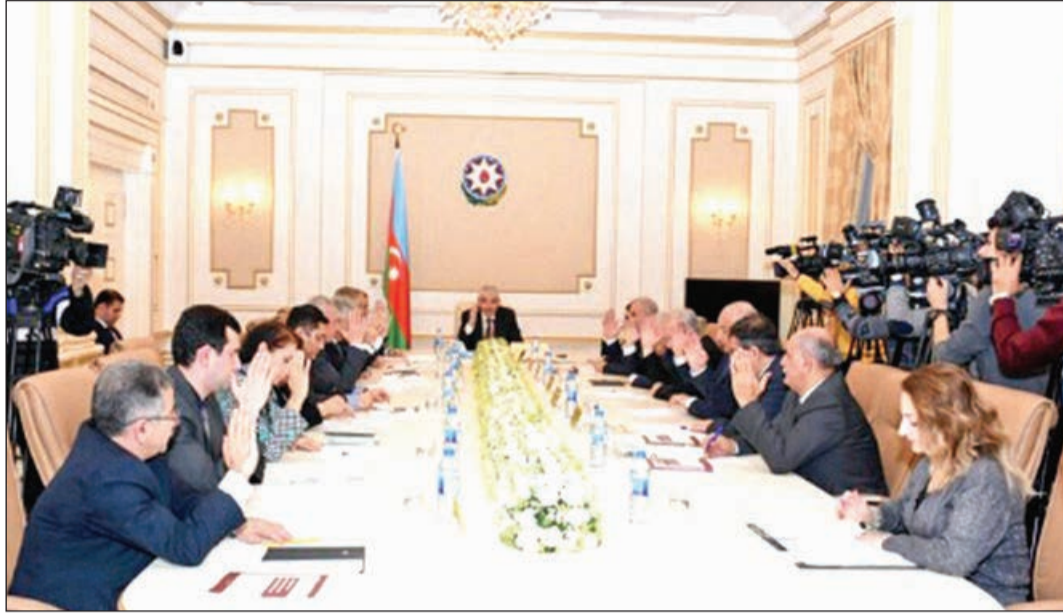
nış işıqlandırılan iclasda dekabrın 23-də keçirilən bələdiyyə seçkiləri və qarşıdan gələn 9 fevral Milli Məclisə seçkilərə dair cari məsələlərdə baxılıb.

Sonra 2019-cu il dekabrın 23-də keçirilmiş bələdiyyə seçkiləri ilə əlaqədar MSK-ya daxil olmuş müraciətlərə baxılıb. Seçki Məcəlləsinin tələblərinə uyğun olaraq, operativ şəkildə komissiyanın iclasına çıxarılan müraciətlərlə bağlı müvafiq qərarlar qəbul edilib. Kütləvi informasiya vasitələrinin nümayəndələri tərəfindən ge-