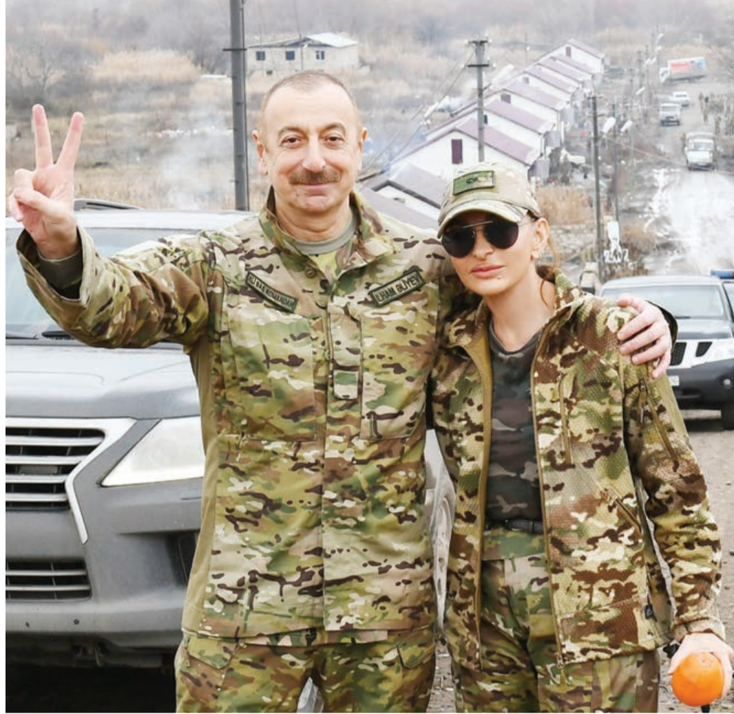
Düzgün anın seçimi

Qarabağ zəfərində şəxsiyyət faktorunun rolunun nə qədər böyük əhəmiyyət kəsb etdiyi zaman keçdikcə daha da aydın dərk olunacaqdır. Həqiqətən də, cənab Prezidentin hərbi və siyasət meydanındakı qrossmeyster məharətilə edilmiş güclü gedişləri məkrli gedişlərini hazırlayan və öz oyununu oynamaq istəyən bəzi dairələri və düşmən qüvvələri məharətlə möğlub etdi.