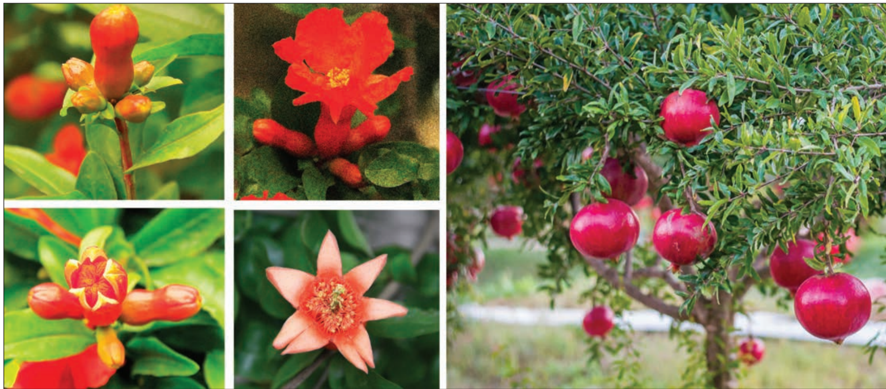
Əvvəlki 1-ci səh.

"İndi İtaliyadayam. Amma sənə deyim ki, Roma ilə Bakını müqayisə etmək mümkün deyil. Sizin paytaxt əfsanəvi şəhərdir. İnsanlar, küçələr və adamlar bir-birinə eyni mahının notları kimi bağlanırlar. Şəhər təmizliyi, insanlar necəliyi və xoş rəftarı ilə ürkəçdir. Roma nə qədər qədim olsa da, Bakıya nisbətən səliqəsiz, insanları böyük şəhərlərin sakinləri kimi digərlərinə qarşı biganədir. İndi başa düşürəm ki, Bakını uşaq kimi sevirəm. Sizin paytaxtın gecəyərində işləyən çayxanaları üçün danırıam. Orada sizinlə xatirələrimizi bölüşürük, deyib-gülürük. Adət etdiyimiz kimi, heç kim içib keflənmirdi, sərxoş olmurdu, doğunca danışıq bilirdik. Mən Romada Bakı üçün daha çox danırıam, Bakıya vurulmuşam və mənə onsuz yaşamaq asan olmayacaqdı. Bakı bulvarı isə şəxsi sizin paytaxtın şah əsəridir. Bakıdan uqanda siz mənə bir zənbil nar və bir də təzə nar çiçəkləri ilə bəzədildim güc dəstəsi bağışladınız. Ömrümdə ilk dəfə idi ki, bir meyvənin yazını da, payızını da qoşa görürdüm. Elə xoşbəxt idim ki!!"