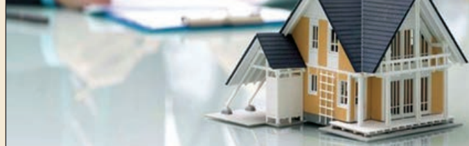
Əvvəli 1-ci səh.

Qeyd edək ki, fərdi yaşayış evlərinin dövlət qeydiyyatına alınması xidməti vətəndaşın istəyindən asılı olaraq 1, 3, 7, 10 iş günü ərzində göstərilə bilər. Çıxarışın verilməsi üçün tələb olunan dövlət rüsumu 30 manatdır. Xidmət haqqı isə Tarif Şurasının 2009-cu il 31 iyul tarixli qərarı ilə müəyyən edilib.