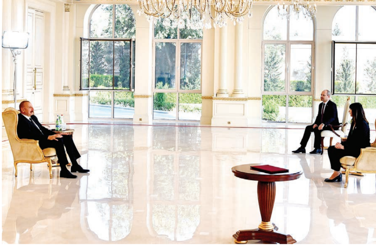
Əvvəli 1-ci səh.

Dayanıqlı inkişaf Məqsədlərini inkişaf etdirməkdə və onlara nail olmaqda Azərbaycanı dəstək vermək üçün burada olmaq və BMT sistemində rəhbərlik etmək mənim üçün şərəfdir.