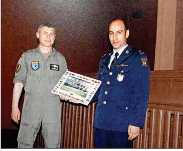
Əvvəlki 1-ci səh.

Zaur anasının bu çətinliklərə necə cəsarətlə sinə gərdiyini görə- görə böyüyürdü.