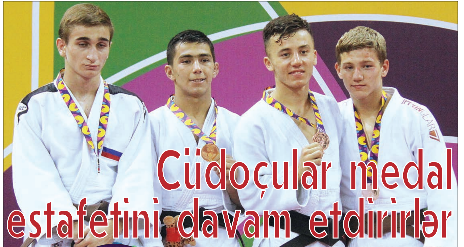
Üvvəli 1-ci səh.