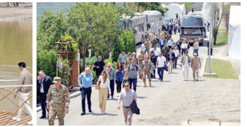
Əvvəli 1-ci sahə.

Bildirilib ki, silahlı tərribata qədər Xankəndidə yaşayan erməni əsilli sakinlər sərhəd-keçid məntəqəsindən heç bir maneə olmadan istifadə ediblər. Hazırda da Beynəlxalq Qırmızı Xaç Komitəsinin vasitəçiliyi ilə tibbi evakuasiya təyinatlı keçidə şərait yaradılır. Başqa sözlə, bəzi dairelərin iddia etdiyi kimi, yol bağlı deyil. Sadəcə, Ermənistanın son tərribatı ilə bağlı müvafiq istintaq tədbirləri həyata keçirilib.