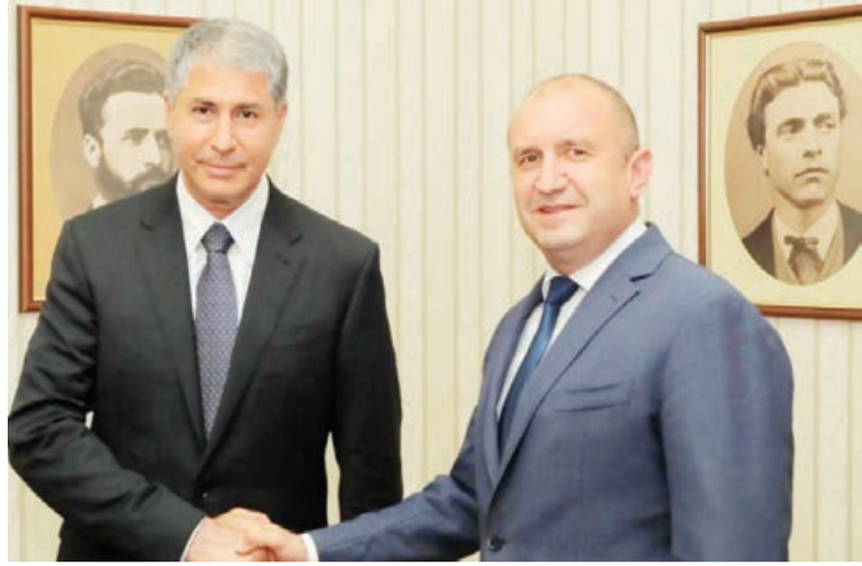
Bolqarıstan Respublikasının daxili işlər naziri Boyko Raşkovun dövlətə il Azərbaycan Respublikasının daxili işlər naziri, general-polkovnik Vilayət Eyvazovun başlıq etdiyi nümayəndə heyəti bu ölkədə ikigünlük rəsmi səfərdə olub.

Nazirlikdən AZƏRTAC-a bildirilib ki, iyunun 23-də Bolqarıstan Respublikasının Prezidenti Rumen Radev daxili işlər naziri Vilayət Eyvazovun başlıq etdiyi nümayəndə heyətini qəbul edib. Azərbaycanın Bolqarıstan üçün strateji tərəfdaş olduğunu söyləyən ölkə rəhbəri dövlətlərimiz arasında əlaqələrin inkişafından məmnunluğunu ifadə edib, hətəröflü əməkdaşlığa böyük önəm verdiyini vurğulayıb. O, iki ölkə arasındakı dostluq münasibətlərini və Sofiya ilə Bakı arasında ümumi maraq doğuran bir sıra sahələrdə strateji dialoqu yüksək qiymətləndirib, cinayətkarlıqla mübarizədə hüquq-mühafizə orqanları arasında əməkdaşlığın təşviqinin Bolqarıstanın Azərbaycanla tərəfdaşlığının yüksəldilməsi üçün mühüm amil olduğunu bildirib.