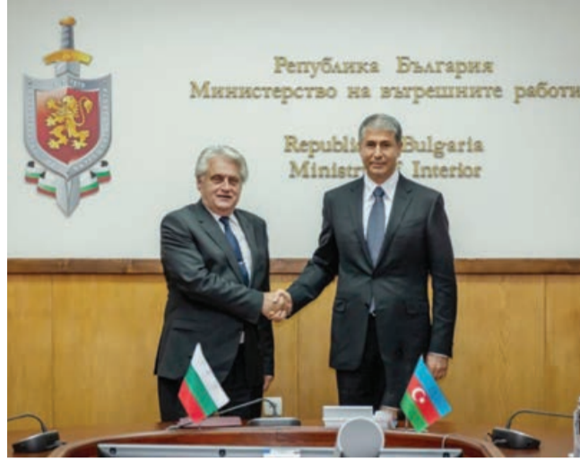
Ilham Əliyev səmimi salamlarını Bolqarıstanın dövlət başçısına müraciət edərək yüksək səviyyədə təşkil olunmasına görə minnətdarlığını bildirdi. O, Bolqarıstanlı həmkarları ilə əməkdaşlığa, transmilli mütəşəkkil cinayətkarlığın müxtəlif təzahürləri, terrorçuluq, kibercinayətkarlıq, insan alveri, narkotik vasitələrin qeyri-legal dövriyyəsi, qanunsuz miqrasiya sahəsində təcrübə və məlumat mübadiləsinin həyata keçirilməsində maraqlı olduğunu qeyd etdi.

Göstərilən diqqətə, Azərbaycan haqqında xoş sözlərinə, dəyərli fikirlərinə, eləcə də nümayəndə heyətini qəbul etdiyinə görə Bolqarıstan Prezidenti Rumen Radeva təşəkkürünü bildiren daxili işlər naziri Vilayət Eyvazov Prezident