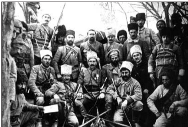
Andranik banda üzvləri ilə