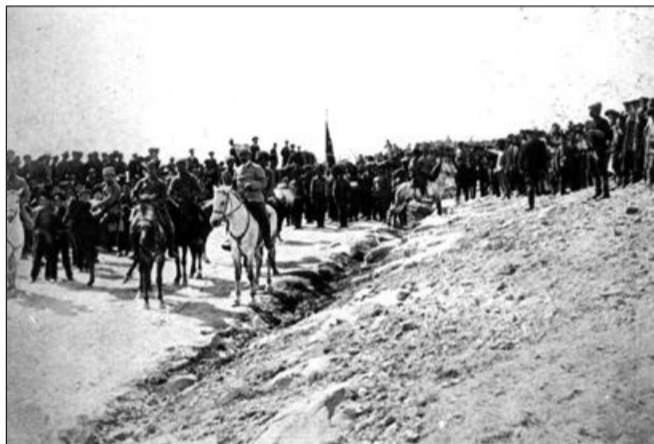
Erməni silahlı terror dəstəsi (1915)