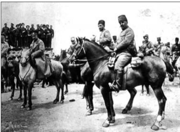
Erməni bəndələrinin Vana hücumu